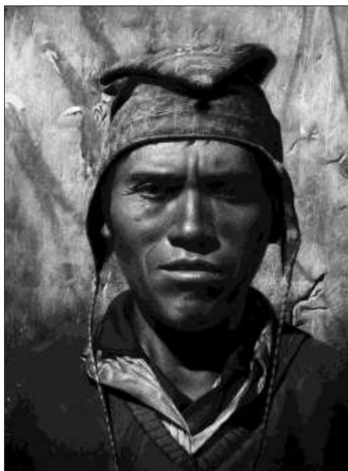
Rosmery Mamani Ventura. Voces del corazón . Pastel / pastelmat, 80 x 60 cm.

Según Reyes (2015), poco se ha estudiado sobre la conformación del Bloque Independiente Campesino y su impacto político. Quizá su capítulo más sobresaliente haya sido la participación en la Asamblea Popular de mayo de 1971. Por otra parte, en el valle se conformó una confederación paralela, la Confederación Independiente de Trabajadores Campesinos de Bolivia (CITCB) que tenía una clara influencia maoísta, y que también participó en las sesiones de la Asamblea Popular (1971). Sin embargo, la Asamblea Popular tuvo una clara composición obrera y una minoría campesina ya que se consideraba que los mineros eran la vanguardia de cualquier revolución. Es por ello que no se admitió la participación de la Confederación Nacional de Trabajadores Campesinos de Bolivia (CNTCB).