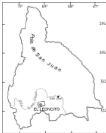
Figura 1. Localización del Parque Nacional El Leoncito (San Juan)

El Parque Nacional El Leoncito ubicado al occidente de las Sierras del Tontal, San Juan (Figura 1), abarca aproximadamente 74.000 ha, en un gradiente altitudinal entre los 1900- 4500 m s.m. (Minetti, 1986; Poblete et al. , 1999). Estos autores establecen para la zona más baja (Provincia Fitogeográfica del Monte) precipitaciones menores a los 100 mm anuales y temperaturas medias anuales siempre inferiores a los 22°C. En los sectores a mayor altitud las precipitaciones medias anuales superan los 400 mm y las temperaturas son inferiores a los 10°C en todos