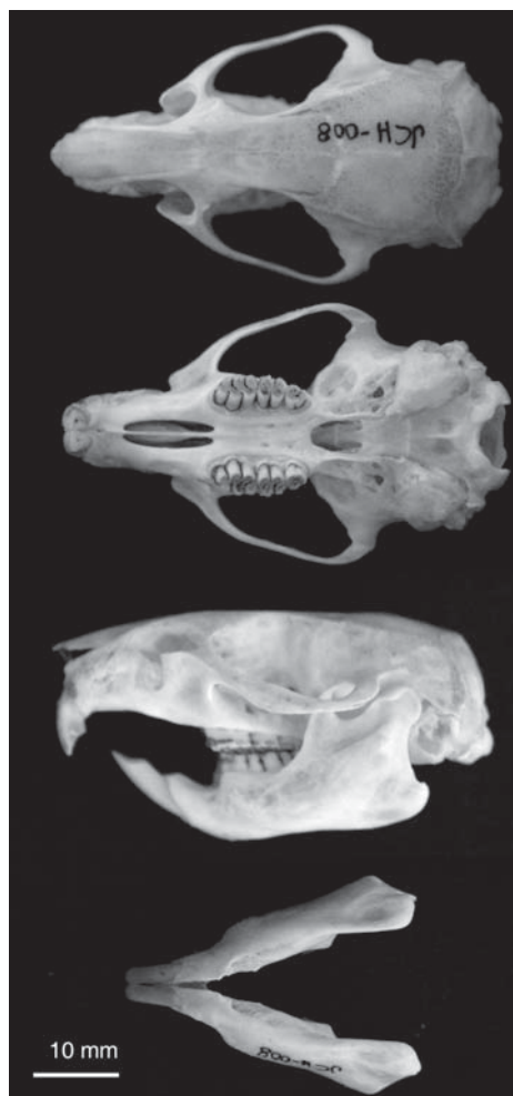
Fig. 3. Vista dorsal, ventral y lateral de cráneo y mandíbula, además de mandíbula en vista dorsal del ejemplar de Kunsia tomentosus colectado en Pampas del Heath (JCH 008).