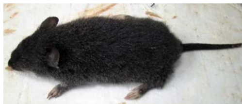
Fig. 2. Ejemplar de Kunsia tomentosus colectado en Pampas del Heath (JCH 008): vista dorso-lateral del animal previo a su preparación (foto de campo). Nótese el pie bicolor y el desarrollo de las garras anteriores, características de la especie.

El hábitat es una sabana arbolada semi-sempervirente (pampas-termitero) (Navarro y Maldonado, 2004). Según la caracterización vegetal realizada por Gonzales y Nensen (2007), la vegetación en la zona de captura se halla dominada por las especies Macairea radula , Tapirira guianensis , Miconia cf. cuspidata , Matayba guianensis , Schefflera morototoni , Graffenrieda wedellii , Mircia fallax , Erythroxylum cf. macrophyllum , Pterogastra diravigata , Protium unifoliolatum , Bellucia acutata , Miconia tomentosa , Maprounea guianensis , Vismia floribund ; los