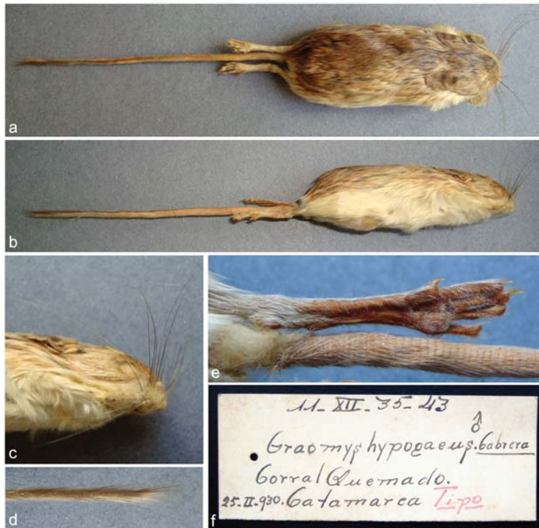
Fig. 1. Holotipo de Graomys hypogaeus Cabrera, 1934 (MLP 11.XII.35.43): vista dorsal (a) y lateral (b) de la piel rellena; detalles de pata trasera izquierda en vista plantar (c), vibrisas (d) y ápice de la cola (e); etiqueta original del espécimen (f).