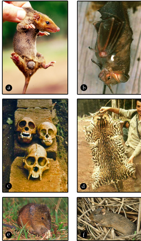
Fig. 3. Algunos mamíferos registrados en la Reserva Privada de Usos Múltiples Valle del Cuña Pirú, Misiones, Argentina: a) Monodelphis scalops , b) Pygoderma bilabiatum ; c) cráneos de Cebus apella cazados por aborígenes; d) piel de Leopardus pardalis ; e) Oxymycterus misionalis , f) Euryzgomatomys spinosus .

(n=3); LP = 14.7±1.5 (n=3); LO = 9.7±2.5 (n=3); P = 21.8±7.2 (n=3).