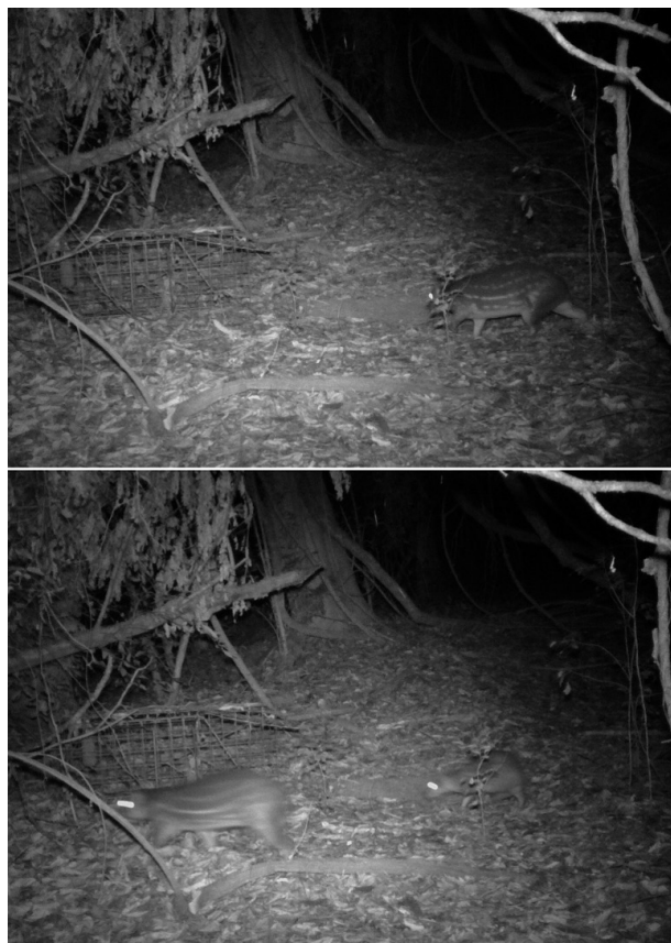
Fig. 2. Secuencia de fotos de un adulto de Cuniculus paca (arriba) y del mismo individuo con una cría (abajo) obtenida en la estancia Guaycolec (Formosa, Argentina).

Si bien un estudio indirecto utilizando trampas cámaras no puede sustituir observaciones directas de una especie, en este caso, el uso de las trampas cámaras no solo confirma la presencia sino que también genera nuevo conocimiento sobre la ecología y comportamiento de C. paca . Las fotos fueron obtenidas únicamente a menos de 170 m del río, en concordancia con la descripción de la paca como una especie que prefiere áreas cercanas a cursos de agua (Pérez, 1992). Con respecto a los patrones de actividad, estudios anteriores sugieren que la especie es nocturna (Smythe, 1987; Pérez, 1992; Braekevelt, 1993; Beck-King et al., 1999; Sabatini y Paranhos da Costa, 2006) lo que a su vez se confirma con estos registros ya que no se obtuvieron fotografías durante el día. Estos resultados también sugieren que la especie evita noches muy oscuras (luna nueva), así como noches con mucha luz (luna llena). Este patrón de