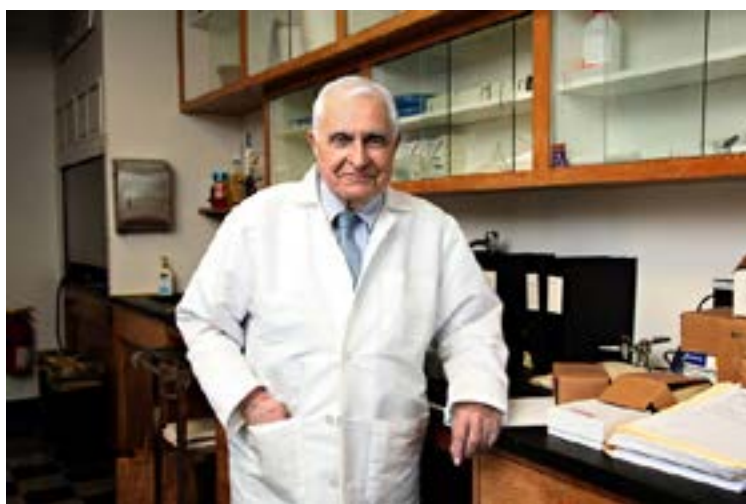
Figura 4 Jules Hirsch en la época final de su actividad científica (hacia 2012)

Declaración de conflicto de interés: los autores han completado y enviado la forma traducida al español de la declaración de conflictos potenciales de interés del Comité Internacional de Editores de Revistas Médicas, y no fue reportado alguno en relación con este artículo.