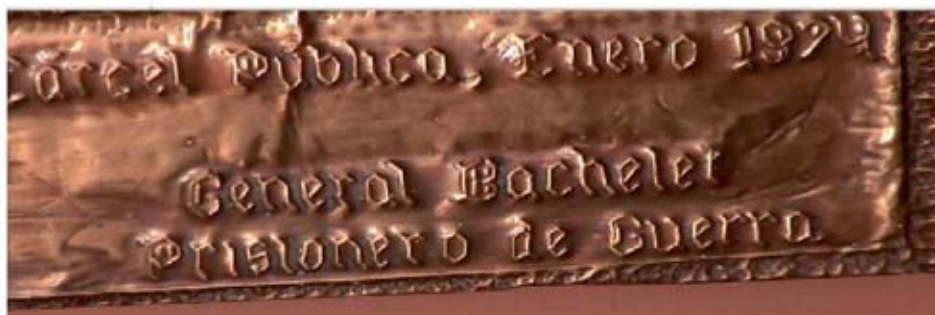
Detalle Imagen 3

cumplir 22 años. Este documento, al igual que las declaraciones de Ángela, está impregnado de AFECTO (“felicidades”, “abrazos y besos”) que expresa la felicidad de un padre que muestra su amor paternal; sin embargo, la segunda parte del extracto se contrapone a la primera, como se puede sentir por el uso de la contraexpectativa expresada por la conjunción contraargumentativa “pero”. Al inicio del extracto citado, a través de una acumulación de polaridades negativas, se expresa el AFECTO negativo, la infelicidad del padre por la falta de libertad. Él utiliza la GRADACIÓN; las formas verbales futuras expresan deseos incumplidos que se intensifican a través de la repetición: