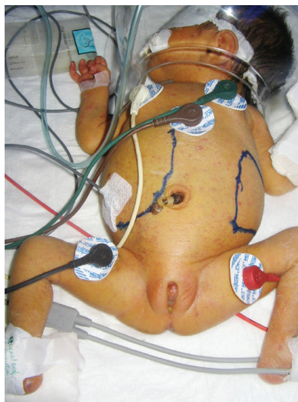
Figura 1. Recién nacido pretérmino con importante hepatoesplenomegalia, ictericia y Petequias diseminadas.

El diagnóstico de citomegalovirus congénito se realizó con base en el historial clínico (pequeño para la edad gestacional, microcefalia, Petequias, púrpura, hepatoesplenomegalia, coriorretinitis, ictericia, figura 1); la serología del recién nacido fue IgM-anti-CMV positiva en ELISA y la serología materna se mostró positiva a IgG-anti-CMV y negativa a IgM-anti-CMV. Asimismo, se realizó un ultrasonido transfontanelar coronal que reportó calcificaciones periventriculares (figura 2).