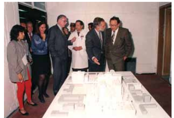
Planeando la remodelación, 1992.