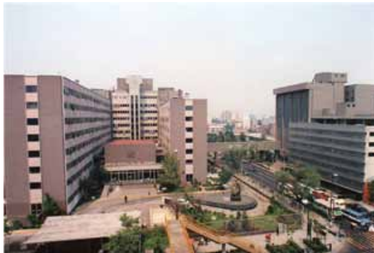
Vista panorámica del Centro Médico Nacional en la década de 1990.