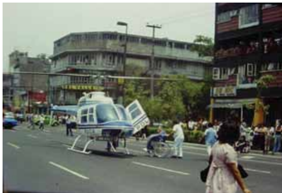
Centro Hospitalario 20 de Noviembre. Faltaba un helipuerto.