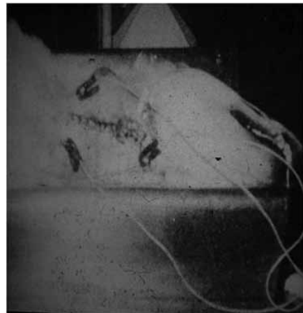
Cirugía experimental. Trasplante heterotópico, 1975.