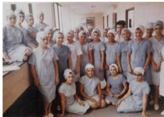
Enfermería quirúrgica, 1968.