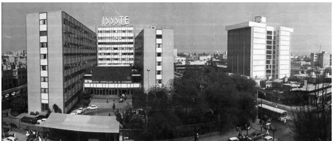
Terminada la residencia, 1971.