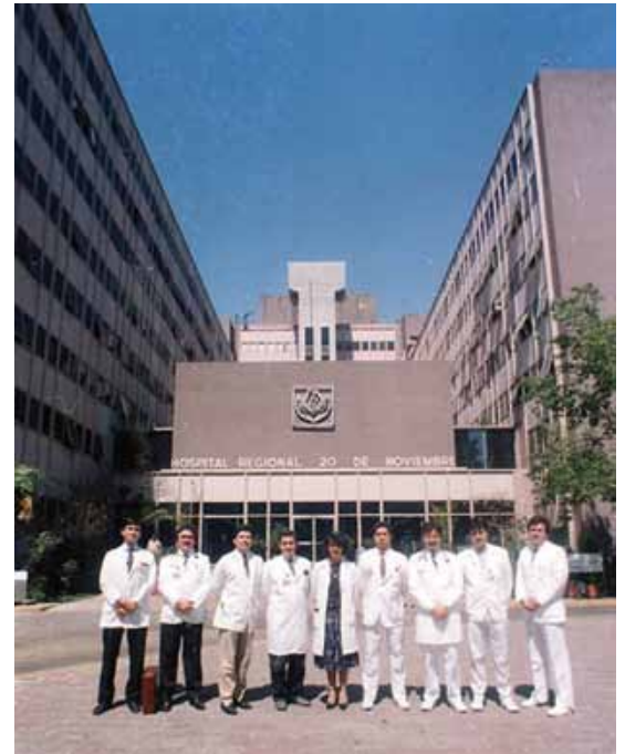
Algunos especialistas egresados en 1991.