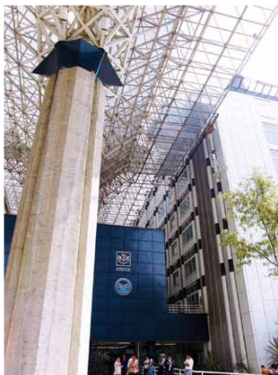
El Centro Médico Nacional 20 de Noviembre en la actualidad.