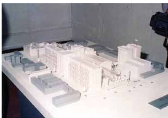
La maqueta de remodelación.