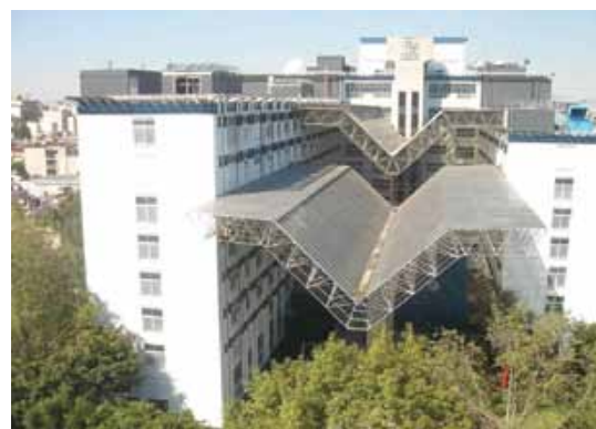
El Centro Médico Nacional 20 de Noviembre en la actualidad.