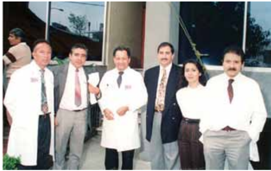
En plena remodelación.