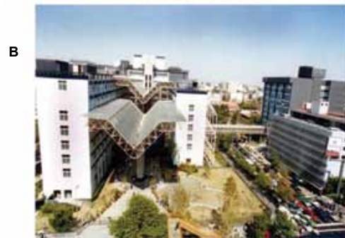
A. Edificio D sobre Av. San Lorenzo, lugar donde se encuentra el Bioterio, el cual servía de adiestramiento para médicos. B. Vista panorámica del Centro Médico Nacional 20 de Noviembre, a espaldas está el edificio D.