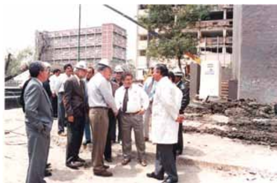
Empezó la remodelación.