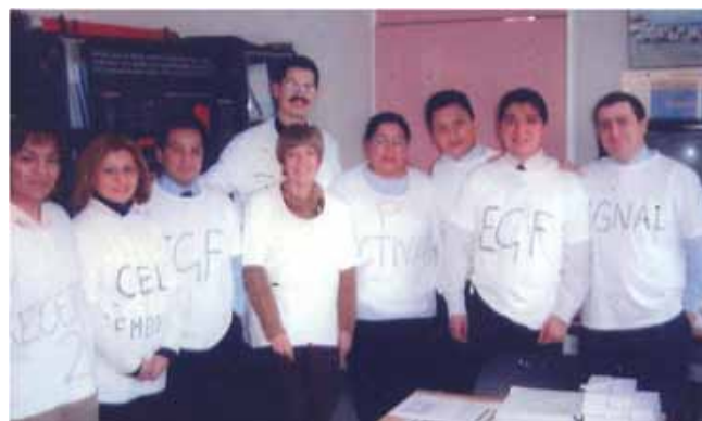
Equipo de oncología médica.