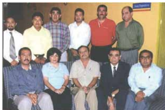
Grupo de pacientes trasplantados del corazón, 2004.