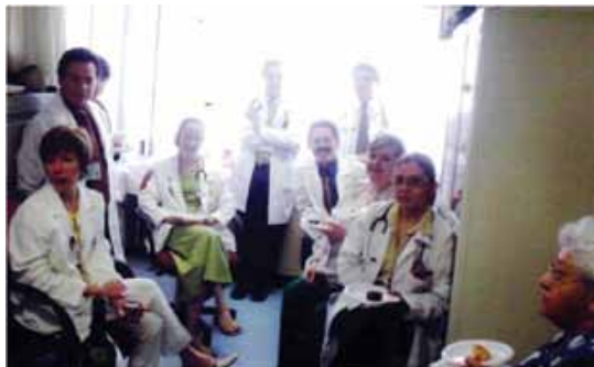
Equipo de oncología médica en el servicio.