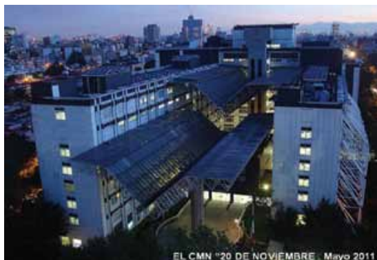
Centro Médico Nacional 20 de Noviembre, mayo de 2011.