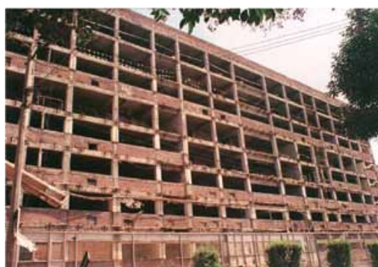
Edificios descubiertos. Vista lateral sobre Avenida Coyoacán.