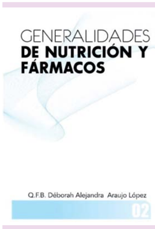
Figura 2. Libro Generalidades de nutrición y fármacos .

más en el tema; despertar el interés para poder tener conocimientos más precisos de las interacciones, evidencias clínicas y más éxito en la farmacoterapia de los pacientes. Incluir poco a poco esta valiosa información en las monografías y fichas de los medicamentos, incluso en los envases de los mismos, tal y como ha sucedido con las interacciones medicamentosas.