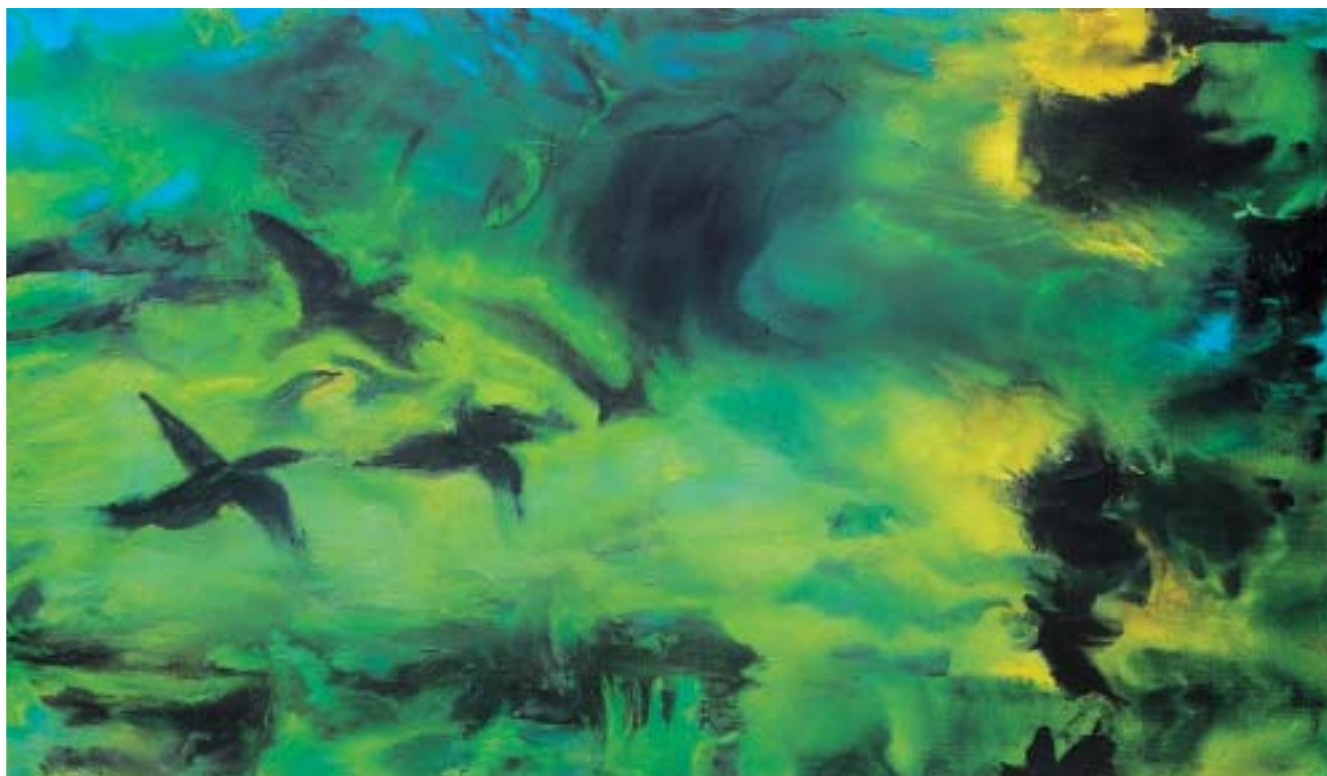
Pájaros en el río • Óleo sobre lienzo, 180 x 105 cm, 2001

en la escalera rodante” necesité usar los colores fluorescentes. Nuevamente busqué ayuda donde el doctor George Kloetzner y él me puso en contacto con otro alemán, el doctor Bloch que me instruyó sobre los pigmentos fluorescentes y su comportamiento con la luz negra.