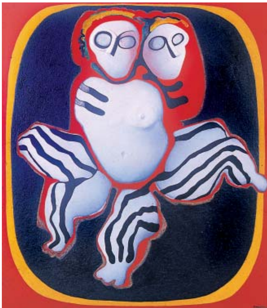
Ángel de la pijama a rayas • Técnica mixta, 150 x 130 cm, 1996

pintura en el Salón Grancolombiano. En el 65 gané el segundo premio de pintura en el primer salón Panamericano. Esos años se caracterizaron por la investigación. Yo empecé a pintar en óleo sobre lienzo. La primera serie se llama Alas de Mariposa y Magia en la Montaña. La geografía brasileña es plana. Cada seis meses me tocaba viajar con mi esposo al Ecuador porque se vencía mi visa. Entonces esa monumentalidad de los Andes me impactaron mucho y pinté la serie de Magia en la Montaña en 1961.