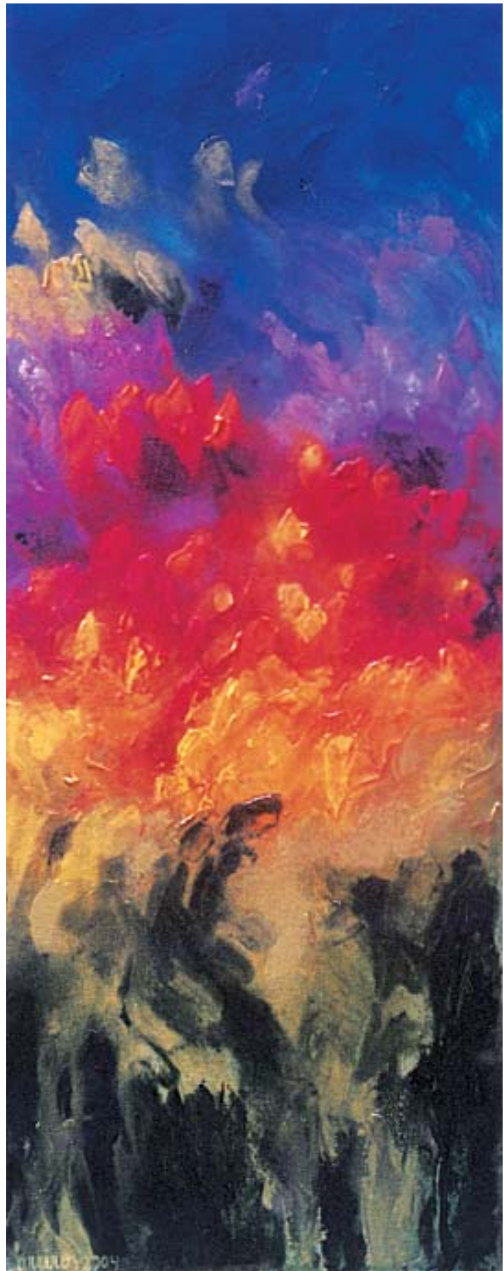
Selva Florida, Óleo sobre lienzo, 90 x 36 cm, 2004

Una época totalmente impregnada por todo lo que pasa alrededor. Era la época de la luz negra, de las pinturas fluorescentes, paz y amor, de los hippies, el amor libre. Éramos bohemios. Siempre tuve conciencia y siempre dije que el artista debería sentir las cosas que pasan cerca de una, como la sal en la piel. Desconfiaba mucho del artista latinoamericano que se iba del país e intentaba hacer arte latinoamericano; si en América Latina hace calor y en Europa está haciendo frío cómo voy a hacer para que mi obra produzca la sensación de calor. En 1968 cuando hice “Mujer