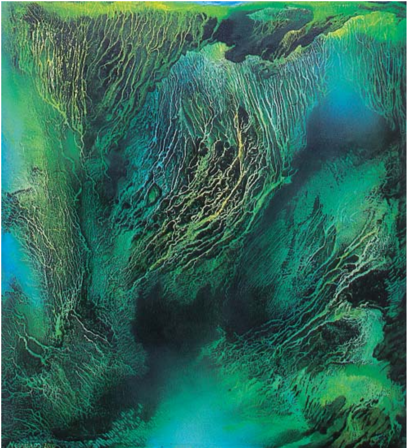
Igapó • Óleo sobre lienzo, 110 x 100 cm, 2000

gresar al Amazonas a dar asistencia a mi padre quien padecía de una enfermedad terminal. Fueron años en que tuve que sentir cambios enormes en el medio ambiente debido a la destrucción de selva sin control, incendios forestales, extinción de fauna, etc. Sentí una gran soledad y en ese momento para mí la soledad