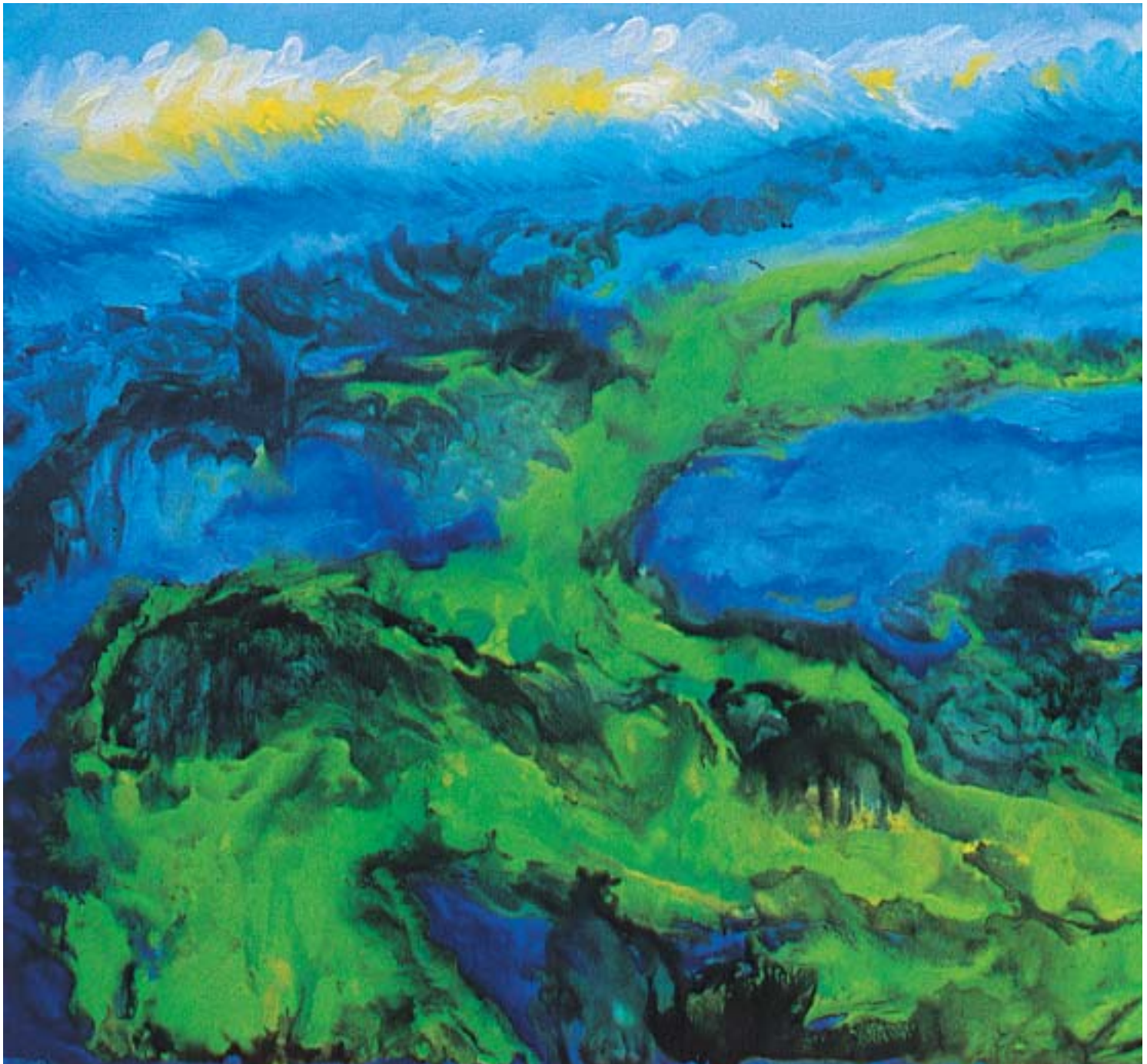
Anavilhanas (Díptico) • Óleo sobre lienzo, 180 x 200 cm y 180 x 170 cm 2002