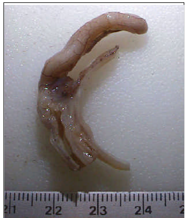
FIGURA 3. Pared delgada compartida entre el quiste de duplicación y el resto de estructuras intestinales, con las tres capas de la pared intestinal presentes.