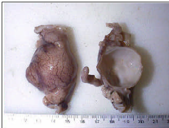
FIGURA 1. A la izq. se observa íleon de mayor calibre que el ciego, serosa congestiva, con trayectos vasculares prominentes. Der. lesión quística del lado mesentérico, ocluyendo la luz intestinal a nivel de la válvula ileocecal.

Histológicamente, a partir de la pared del íleon se identificó una formación quística a nivel de la válvula ileocecal una