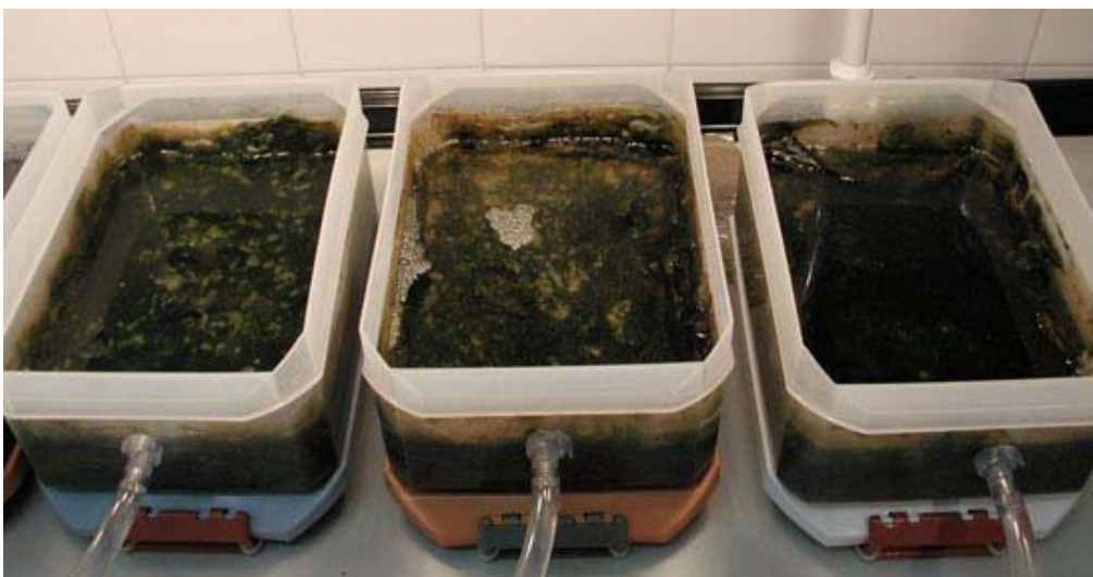
Figura 3. Microcosmos preparados a partir de los tapetes microbianos del Delta del Ebro.

Los microcosmos utilizados en los experimentos de laboratorio son modelos miniaturizados con múltiples componentes, que permiten comprender las relaciones que se establecen entre las poblaciones microbianas, así como la función de éstas en el ecosistema cuando tiene lugar un episodio de contaminación ( Fig. 3 ). Estos sistemas, además de los resultados cualitativos, permiten obtener resultados cuantitativos respecto al comportamiento del contaminante en el medio.