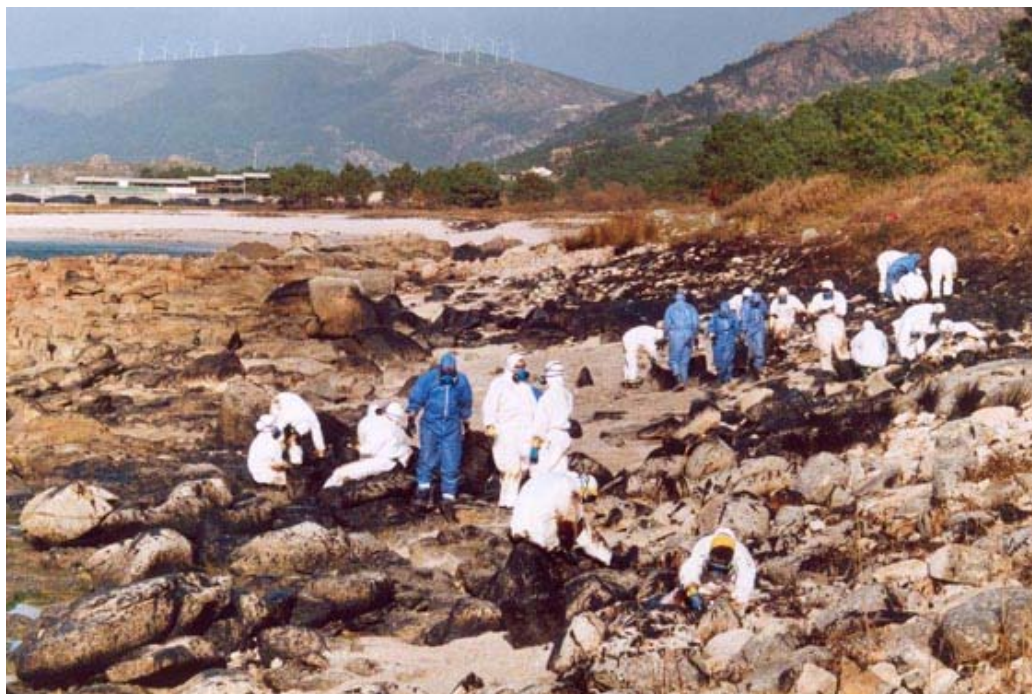
Figura 1. Imagen de la costa gallega después del vertido de petróleo del Prestige en 2002.

El petróleo está compuesto por una mezcla de hidrocarburos que pueden agruparse en cuatro clases: saturados, aromáticos, asfaltenos y resinas (Colwell y Walker, 1977); los cuales, difieren respecto a su susceptibilidad frente a su posible biodegradación. Teniendo en cuenta que la composición del petróleo es altamente variable, el riesgo ambiental que suponen los vertidos de petróleo dependerá de la naturaleza y proporción de los diferentes componentes de éste. Así pues, las características físico-químicas del crudo y su persistencia y biodegradabilidad en un determinado ambiente son de gran interés para evaluar el posible impacto sobre el ecosistema de un determinado vertido.