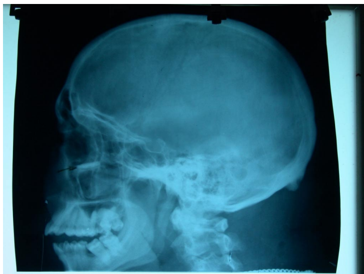
Figura 3 Postoperatoria vista lateral del suelo de órbita reconstruída con Hidroxiapatita