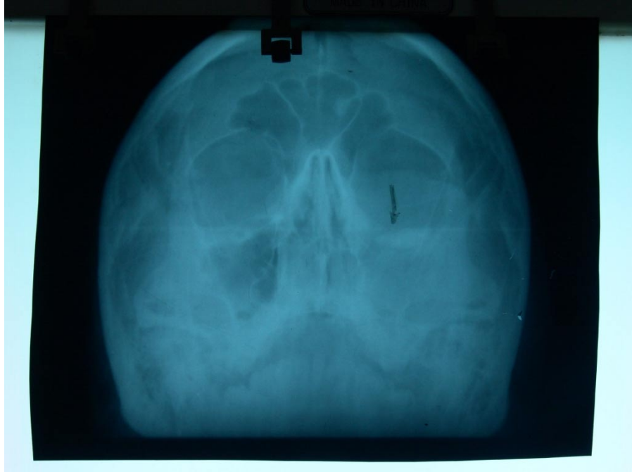
Figura 2 Postoperatoria suelo de órbita reconstruída con Hidroxiapatita