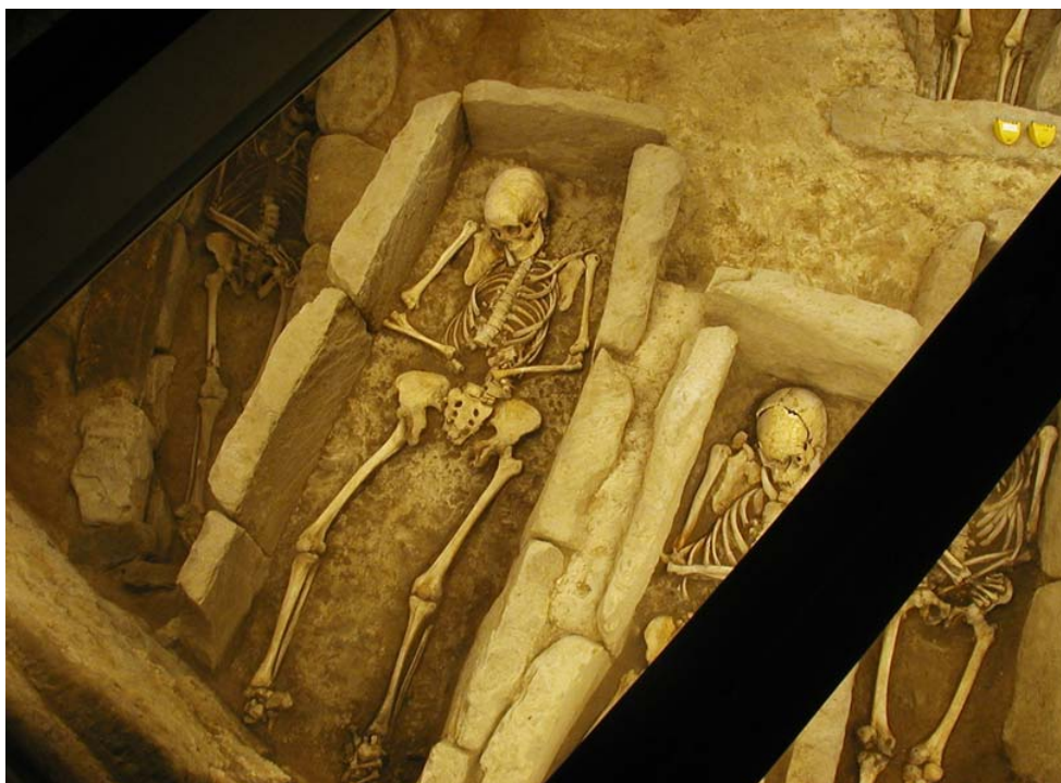
IMAGEN 2. VISTA CENITAL DEL SUBSUELO DE LA SEDE DEL MUSEO DE ARTE E HISTORIA DE ZARAUTZ.

No obstante, lo que patrimonialmente destaca al territorio en este momento, es la significativa cantidad de recursos vinculados a la arqueología, tanto prehistórica, como histórica que encontramos en el mismo. En este sentido podemos citar entre los primeros la estación dolménica de Pagoeta y las cuevas de Granada Erreka y entre los segundos, los interesantes yacimientos con periodos de ocupación medieval y romana de Zarautz y Getaria .