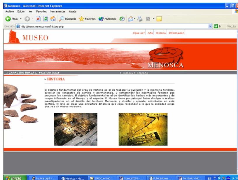
IMAGEN 3. PAGINA WEB DEL MUSEO DE ARTE E HISTORIA DE ZARAUTZ

otros apartados, encontramos que la web ofrece un boletín, catálogos de piezas, oferta de servicios y ventas, y atención al visitante, pero conscientes de que la misma no pasa de ser un primer peldaño pendiente de revisión y mejora.