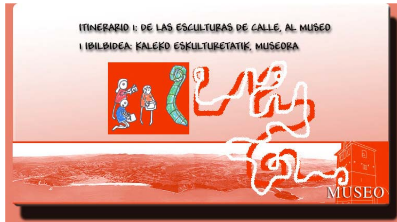
IMAGEN Nº 4: ITINERARIO: DE LAS ESCULTURAS DE CALLE AL MUSEO

En la tercera propuesta motivados por los hallazgos encontrados en el Territorio Menosca, hemos planteado el tema como una oportunidad para integrar en una propuesta didáctica la observación de la naturaleza, la interpretación de los hallazgos y el juego. Una simulación que a través de la webquest, les va a ayudar en la reinterpretación del pasado. La presencia o no de vestigios romanos es un pretexto para reinterpretar el tema de la globalización en la época de influencia romana y ayudarles en la búsqueda del sentido de la propia historia del País Vasco.