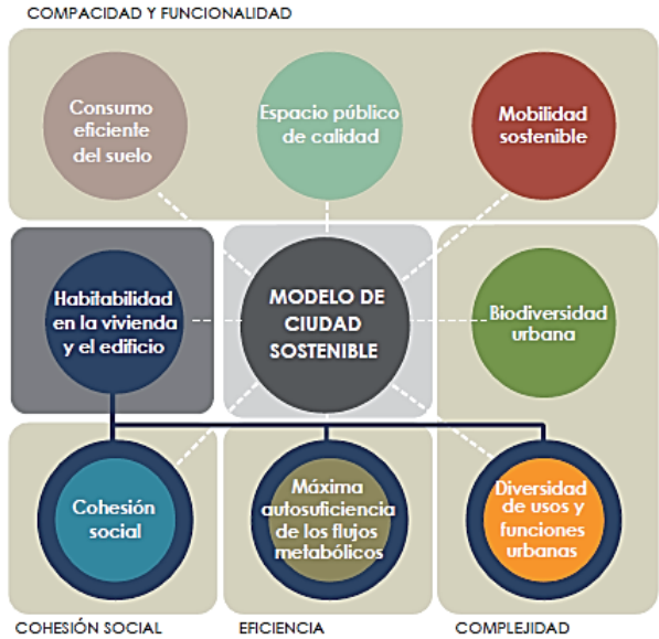
Figura No.1 – Objetivos Básicos del Urbanismo Sostenible

Todo ello nos conduce entonces a afirmar que la globalización han potenciado el rol de las ciudades frente al reto del desarrollo sostenible, debiendo asumir una franca responsabilidad frente a la toma de decisiones que representen efectivos avances y logros para la población a nivel social, económico y ambiental. (UNESCO, 2010).