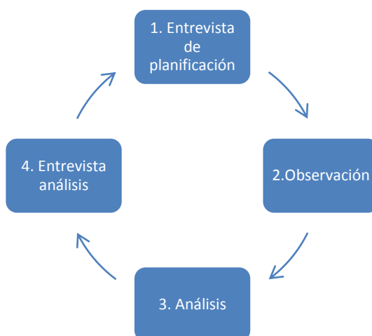
Figura 1. Gráfico del ciclo de mejora

En la fase 1, entrevista de planificación, cada mentor se entrevista con los noveles a su cargo y los informa del plan de asesoramiento: objetivos, acciones, observaciones, análisis, bibliografía aconsejable y temporalización. En la fase 2, observación, el profesor mentor observa la clase impartida por el novel, siendo opcional la grabación en video para su posterior análisis. En la fase 3, análisis, se emplean instrumentos de análisis proporcionados a los profesores mentores, que van dirigidos a analizar las siguientes cinco dimensiones de la práctica en el aula: