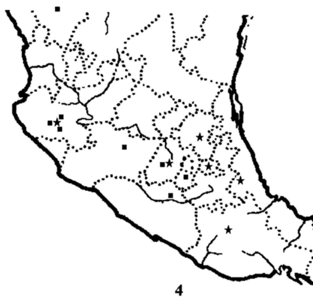
Figuras 3 y 4

Distribución geográfica de: 3. Hesperus fasciatus (Sharp) (rombos) y Philonthus testaceipennis Erichson (estrellas). 4. Philonthus hoegei Sharp (estrellas) y Homalolinus neovulcanicus Márquez (cuadros).