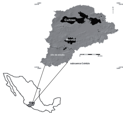
Figura 1. Localización del área de estudio.