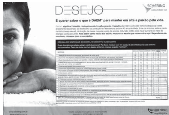
Figura 3. Cuestionario inserto en una revista de gran empresa aérea brasileña.