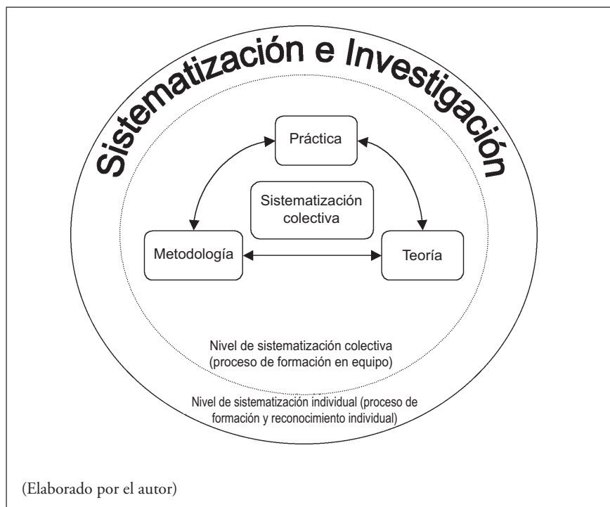
GRÁFICO N° 1 PROCESO DE SISTEMATIZACIÓN-INVESTIGACIÓN-FORMACIÓN.

El gráfico anterior explica que la persona sistematiza su experiencia de formación e investigación socializando la práctica, la metodología y la teoría sobre la cual ha establecido su praxis. La sistematización individual está implícita en la colectiva, y la sistematización colectiva está sujeta a los productos originados de la acción individual.