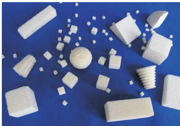
Figura 1. Diferentes formas geométricas en las que se puede presentar el xenoimplante Nukbone®, de acuerdo con la especificación del médico tratante.

los estudios de gabinete: cubos, bloques rectangulares y poligonales, lingotes y placas, como se pueden observar en la figura 1.