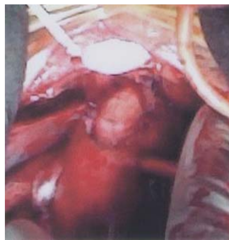
Figura 3. Resultado final de la aneurismorrafia, donde se observa colapso completo del aneurisma conservando la integridad de la arteria. Posición: longitudinal a la derecha.