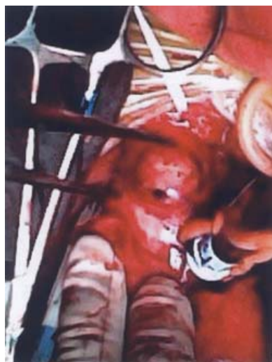
Figura 2. Fotografía del aneurisma sacular en la arteria innominada. Posición: longitudinal a la derecha.

La presentación de un aneurismas de la arteria innominada es poco frecuente y el manejo quirúrgico no se encuentra bien establecido, ya que existen múltiples variedades técnicas para su corrección. 2 Esta malformación vascular puede ser congénita cuando se trata del síndrome de Marfán, de Ehler's Danlos u otra colagenopatía, y puede ser adquirida cuando es secundaria a degeneración aterosclerosa, cuando se debe a infecciones (prin-