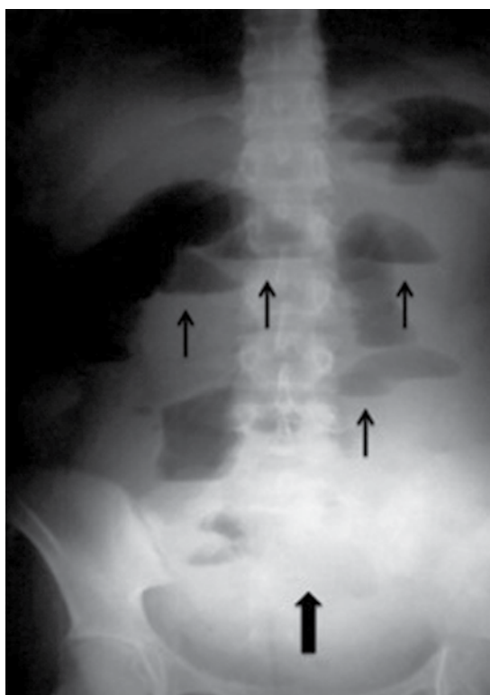
Figura 3. Radiografía simple de abdomen donde se observan varios niveles hidroaéreos señalados por las flechas delgadas. La flecha ancha indica una imagen en vidrio despulido que sugiere líquido libre en la cavidad abdominal. Ambos hallazgos radiográficos son compatibles con un cuadro de obstrucción intestinal.

En la laparotomía exploradora se encontró un tumor en el colon transverso, correspondiente a una invaginación ileo-cólica en la que el íleon terminal, el apéndice cecal, el ciego y el colon ascendentes se encontraron invaginados en el