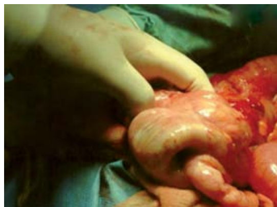
Figura 4. Segmento de intestino delgado invaginado dentro del colon.

colon transverso (Figura 4). Se realizó hemicolectomía derecha sin complicaciones y luego de 18 meses la paciente se encuentra en buenas condiciones generales. El estudio de patología no logró demostrar la posible causa del evento.