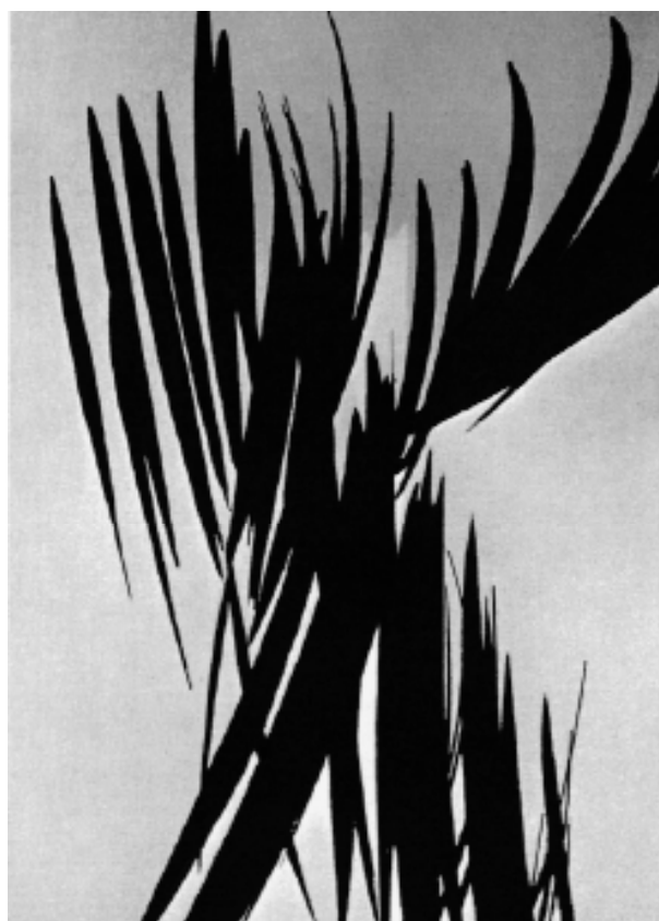
Figura 1. Ejemplo de los estímulos utilizados en el experimento. A la izquierda figura la diana y a su derecha el distractor. De arriba a abajo: estímulo artístico figurativo y artístico abstracto