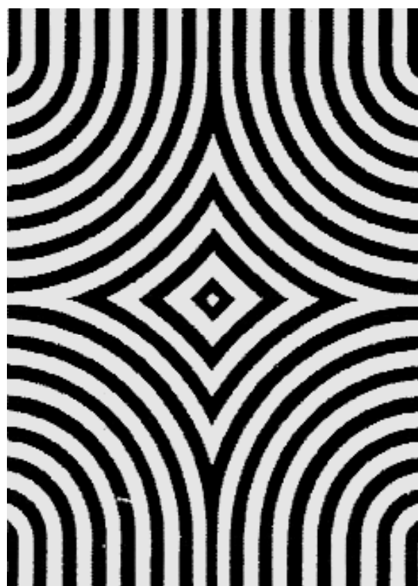
Figura 1. Ejemplo de los estímulos utilizados en el experimento. A la izquierda figura la diana y a su derecha el distractor. De arriba a abajo: estímulo decorativo figurativo y decorativo abstracto