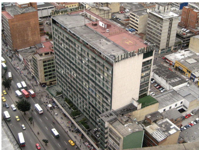
Edificio Seguros Bolívar Carrera 10a. Arquitectos: Cuéllar Serrano Gómez, 1956.

empréstitos para la obra. En el terreno se hicieron visitas y fotografías de 26 edificios para conocer su estado, saber de las intervenciones que habían tenido y ratificar, o no, su calidad, y así llegar a una selección de 21 edificios. Además, hacen parte integral de la publicación mapas, planos, fotos, gráficos y publicidades, material con el que se da la imagen y sentido del momento de la construcción de la avenida, con ellos se refuerza la explicación e ilustra la vida de durante los años de su construcción.