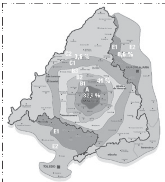
FIGURA 2. Municipios conurbanos en la comunidad de Madrid