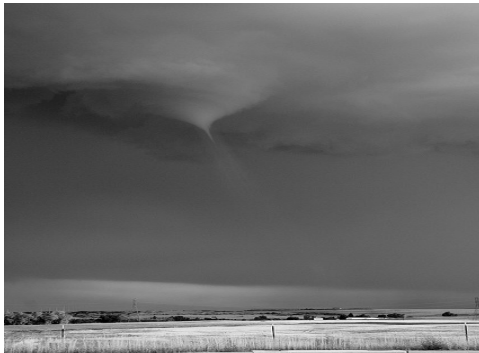
Fig. 1. Tornado [5]

El departamento del Atlántico se ha visto afectado en los últimos años por la presencia de tornados y microtornados que se han generado causando grandes daños y temor en la población. La presencia de este fenómeno meteorológico ha sido tal que organismos como el CAF (Corporación Andina de Fomento) y el Departamento de Atención de desastres del departamento han tomado acciones para tratar de educar a la población en este aspecto. Algunos sólo terminan en amenazas, pero son índices de que la población del departamento es vulnerable a la presencia de tornados, lo que indica a que se tenga un especial cuidado en cuanto a las medidas de alertas y formas de educar y mitigar su efecto en la población que puede ser afectada ante este fenómeno meteorológico.