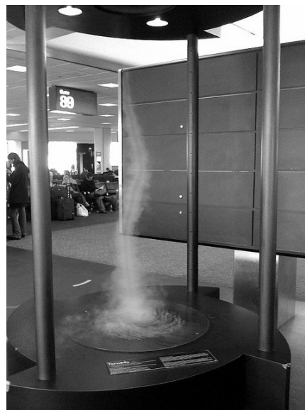
Fig. 9. Simulador de tornado ubicado en el aeropuerto de san Francisco – Estados Unidos. [22]

Otros simuladores utilizan en su diseño un humidificador con el fin de que se pueda observar este fenómeno con mayor claridad y el ventilador lo ubican en la parte superior.