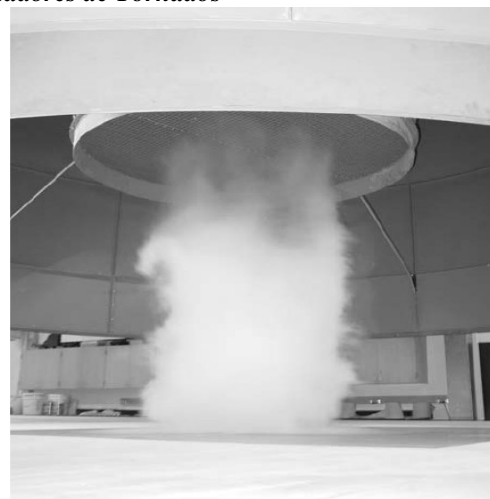
Fig. 7. Simulador de tornado Universidad de Iowa. [24]

Existen otros tipos de avances pero enfocados para el estudio de los tornados, y son los denominados simuladores de tornados.