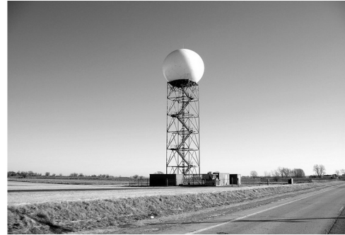
Fig. 2. Radar Doppler Illinois – Usa, similar al que se planea instalar en Medellín. [17]

Debido a la ya mencionada problemática de los tornados en el departamento del Atlántico, se considera prudente realizar una revisión de los principales avances tecnológicos en el estudio de este fenómeno, el cual pueda ayudar a encausar y concientizar algunas necesidades que son requeridas para mitigar los daños que puede causar la presencia de un tornado.