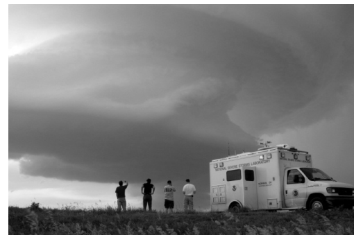
Fig. 3. Misión Vortex 2. [18]

Existen también otros tipos de avances tecnológicos para el estudio de los tornados, algunos usados para la detección y generar alertas tempranas, como los mismos radares Doppler pero menos complejos, ubicados en la superficie terrestre. Para tomar datos para el estudio de los tornados existen grupos de investigadores y científicos que son llamados “cazatornados” y que con ayuda de las entidades meteorológicas se encargan de “cazar” los tornados y tomar mediciones cercanas.