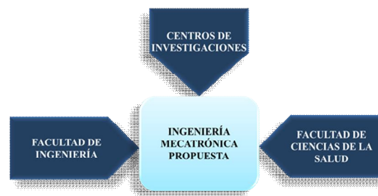
Figura 1. Ingeniería mecatrónica integrada en IES

centros de investigaciones institucionales para el desarrollo de proyectos de investigación multidisciplinarios y transdisciplinarios.