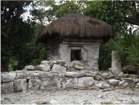
Figura 3. Xaman-Ha

superficiales o arrecifes o también servían como puntos de enfilación a indicaban canales navegables o rutas a seguir. Otras estructuras señalaban las posiciones de sitios del interior, muy útil para los navegantes de larga distancia ya que al no presentar la costa cambios topográficos notables, les permitía conocer el lugar por donde pasaban y estimar, junto con la observación de astros como el sol. 6