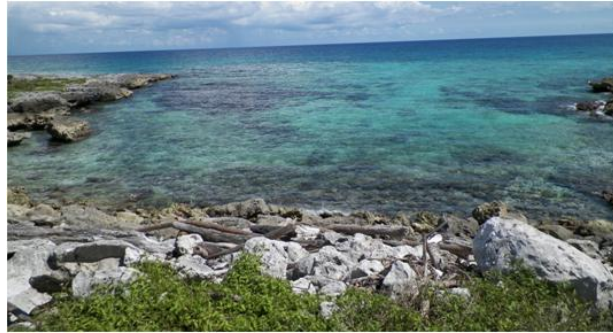
Figura 12. Paamul

La isla de Cancún entre 1300 y 1400 d.C. tuvo su importancia máxima por el auge comercial de la obsidiana que llegaba desde las Tierras Altas de Guatemala hacia el norte de Yucatán. También pasaban objetos de cobre, tanto de uso utilitario como ornamental. Cancún manifiesta una fuerte influencia de Tulum, en su estilo arquitectónico de la Costa Oriental. Xamanhá cobró auge y como sitio de embarque hacia Cozumel. Existió una red comercial costera de importancia en los sitios mencionados sumándose a ellos Xcaret (Polé), encontrándose todos ellos en su momento de máximo desarrollo. Xcaret prolongó su asentamiento tierra adentro con agrupaciones habitacionales. La pequeña caleta donde se asienta este sitio hizo del mismo un lugar propicio para las canoas. Tal fue el caso de Tulum y Paamul (Figura 12), es decir todos fungieron como puertos.