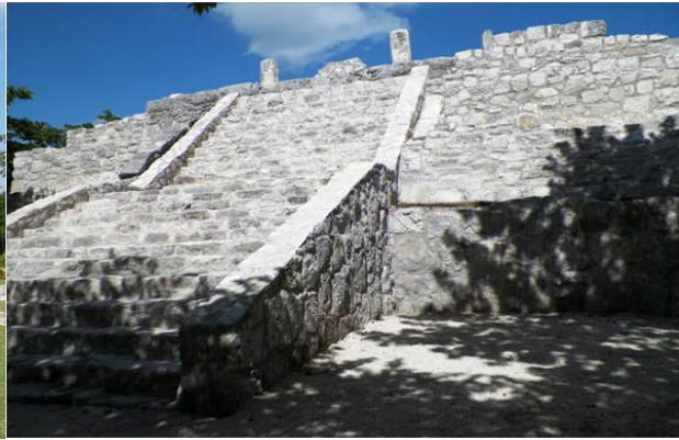
Figura 7. San Miguelito

La Costa Oriental en su parte central, vía Tanchah, se relacionaba por el mar con las planicies costeras del noroeste y el sureste de las tierras bajas de Quintana Roo y Belice. Lo relevante de estos sitios fue sitios como San Miguelito-El Rey escogieron para asentarse una de las partes más anchas de la isla, en donde aprovecharon maravillosamente su topografía; el terreno fue transformado artificialmente por las plataformas para la ubicación de las plazas, estructuras ceremoniales y civiles. Para ello utilizaron la materia prima de los alrededores de la isla y tierra firme. En ambos sitios se aprecian una serie de elementos arquitectónicos y urbanísticos que indican el sentido de planeación, aprovechamiento del lugar, conocimientos constructivos y tradición estilística, mismos que se reflejan en los espacios abiertos como plazas y caminos. Los conocimientos constructivos quedan de manifiesto en la utilización de la materia prima del lugar en pisos, columnas, techos, rellenos, se aprecia en los detalles arquitectónicos de los edificios y plataformas. 9