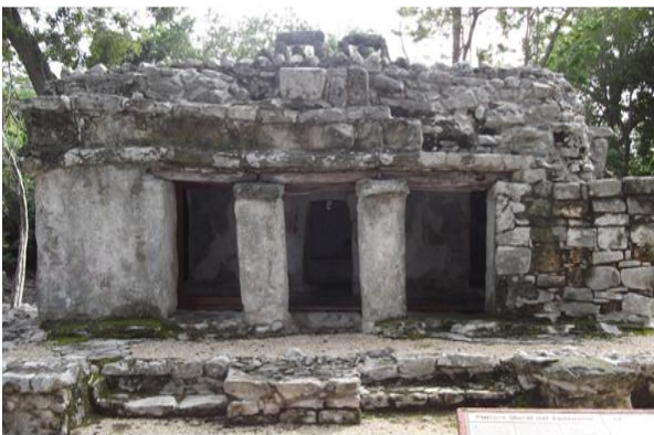
Figura 5. Xelhá

En la Costa Oriental se reportan trece sitios correspondientes al periodo Preclásico Tardío (300-500 a.C.) Para los primeros asentamientos mayas, dos de los principales tenemos: Boca Paila y la Isla de Cozumel, probablemente desde Playa del Carmen (Xaman-Há) (Figura 3) comenzó el desplazamiento hacia las regiones antes descritas, como sabemos en esta última hubo huellas de poblamiento: Xcaret, Xelhá (Figura 4 y Figura 5) y Tancah.