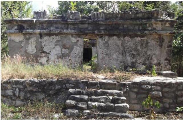
Figura 10. Akumal

marítima de intercambio posiblemente funcionaba como una vía sin restricciones. Muyil es un ejemplo de la arquitectura del Petén con cierta semejanza arquitectónica con los vestigios de Tikal en Guatemala. Su emplazamiento lacustre —propriadamente en la laguna de Sian Ka'an— le daba al lugar una posición estratégica en la ruta comercial de los mayas a lo largo de la costa y a través de una red de canales de esta región. Entre los bienes intercambiados a lo largo de esta ruta estaban el jade, la obsidiana, el chocolate, la miel de abeja, las plumas y desde luego la sal. 9 Sin embargo Xelha y San Gervasio parecen haber funcionado como puertos importantes en esta vía. Servían como centros de fabricación de artículos diversos y además como puntos de transbordo. 11