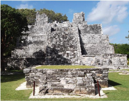
Figura 6. El Meco

En periodo Protoclásico (50 a.c. 250 d.C) comienza a existir una gran actividad en la Costa Oriental, al norte sobresale: El Meco, San Miguelito-El Rey (Figura 6 y Figura 7) con un desarrollo propio; en este periodo se propicia la colonización de la isla de Cozumel con un asentamiento humano considerable, posiblemente favorecido por la existencia de una ruta comercial marítima.