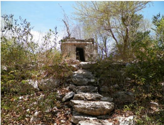
Figura 11. Xcalacoco

En el periodo Postclásico tardío (1200-1550 d.C.) Mayapán asumió la hegemonía política aparentemente el interés comercial se dirigió hacia la Costa Oriental, por lo que ésta logró entonces su máximo desarrollo. En su parte norte las densidades de población fueron mayores; alcanzando los sitios menores más de medio kilómetro cuadrado de extensión,