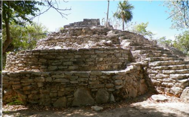
Figura 4. Xcaret