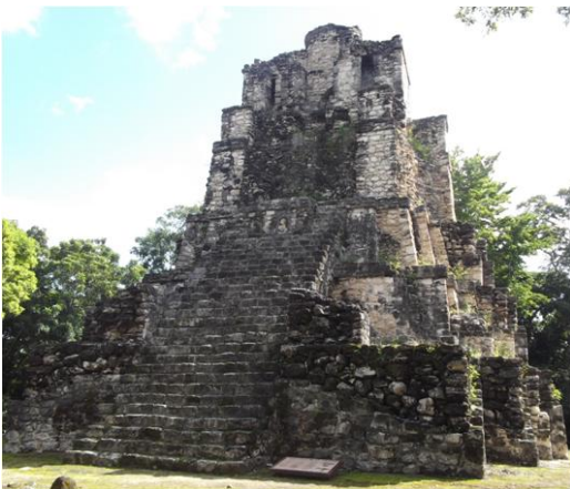
Figura 9. Muyil

Es posible que sitios costeros como Xcaret, Xelhá, Tanchah y Muyil (Figura 9) hayan contribuido al debilitamiento económico y político de Coba. Muyil sus pobladores tuvieron una economía basada en la explotación de su variado entorno (selva, lagunas y mar).