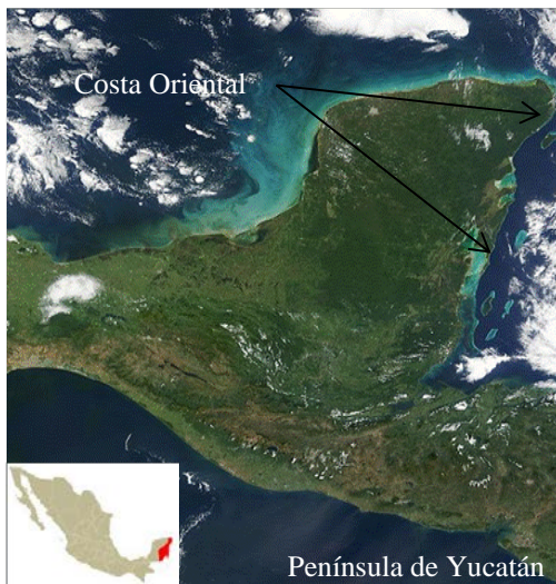
Figura 1. Ubicación geográfica de la Costa Oriental en la Península de Yucatán

La presente revisión bibliográfica se llevó a cabo a partir de la búsqueda de diversos artículos escritos en Redalyc, Dialnet así como la página mexicana del Instituto Nacional de Antropología e Historia (INAH) con el propósito de conocer la importancia de las diversas ciudades de la Costa Oriental, comercio y navegación que tuvo la cultura maya en la Costa Oriental la cual se encuentra ubicada en el Caribe mexicano y comprende desde la costa norte del Estado Quintana Roo hasta el litoral de Honduras. Una limitante del estudio es que al recabar la información existen pocas fuentes con respecto al tema en cuestión y lo que se llega a encontrar son artículos sin sustento o que son anecdóticos (Figura 1).