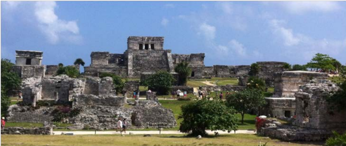
Figura 8. Tulum

A nivel regional Coba fue la ciudad que concentró y redistribuyó bienes y servicios; su red de caminos fue un complemento de sus rutas costeras. Coba mantuvo estrechos lazos culturales con los lejanos reinos del sur, lo que se refleja en el estilo de su arquitectura con tradición del Petén; el arte pictórico de Coba se manifiesta en las pinturas de la estructura El Cuartel las que están relacionadas estilísticamente con las pinturas de Bonampak y Mulchic. La expansión de Coba debió crear una sociedad cada vez más compleja con intereses diversos y lugares por controlar a distancias más largas; aunado esto a un incremento demográfico con una tecnología limitada, lo que a la larga produjo la decadencia de Cobá como unidad hegemónica.