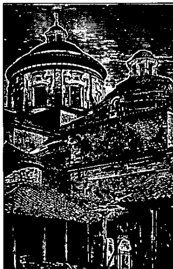
Iglesia de San Ignacio, grabado de Rodríguez y Barreto, 1885, Papel Periódico Ilustrado .

Estando en juego su credibilidad, en su respuesta menciona el origen, sin dejar de reconocer antes los fines del periódico y el carácter que les asigna a las colaboraciones, subrayando lo que privilegia en estas y lo que a su parecer no existía entonces, pues de lo que se trata y en lo que se complacía hasta el