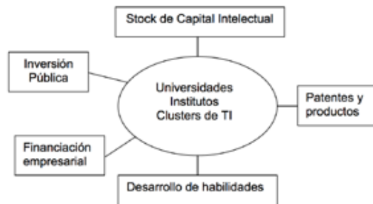
GRÁFICO 3. FLUJOS DE ACTIVIDAD DE INNOVACIÓN PARA LA R.P. CHINA