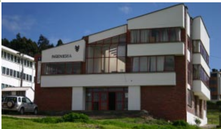
Edificio Facultad de Ingeniería Universidad Pedagógica y Tecnológica de Colombia

gastos para otros niveles de enseñanza, era compensado debido a que estas dependencias anexas, le servían como lugar de prácticas y suministrar los futuros alumnos, al nivel de enseñanza superior.