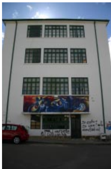
Detalle Costado Occidental Universidad Pedagógica y Tecnológica de Colombia

En este apartado, busco examinar la ejecución de gastos realizados de toda la Universidad y por dependencias, mostrando cuál fue la dinámica en cada una en los egresos en cuanto a sueldo del personal docente y administrativo, gastos generales y/o becas y alimentación, construcciones e inversión, y otros gastos varios. Allí se observó como algunas dependencias 14 permanecieron en todo el período en estudio, otras fueron creadas y otras eliminadas. Enseguida, se estudió los dineros según su destinación bien para funcionamiento o para inversión. En los de funcionamiento, se encuentran: servicios personales, becas y alimentación, gastos generales y otros rubros no determinados, por adiciones presupuestales posteriores.