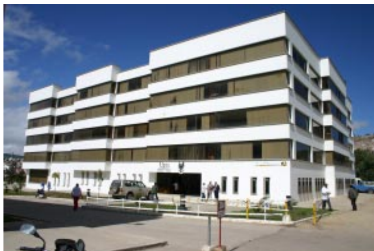
Edificio Administrativo Universidad Pedagógica y Tecnológica de Colombia

Con la información presupuestal recopilada en los anteriores apartados sobre la universidad, fue posible calcular las cifras del costo por estudiante y dependencia, desde la misma institución para confrontarlas con las investigaciones de ASCUN, sobre el gasto público en la educación superior para la época.