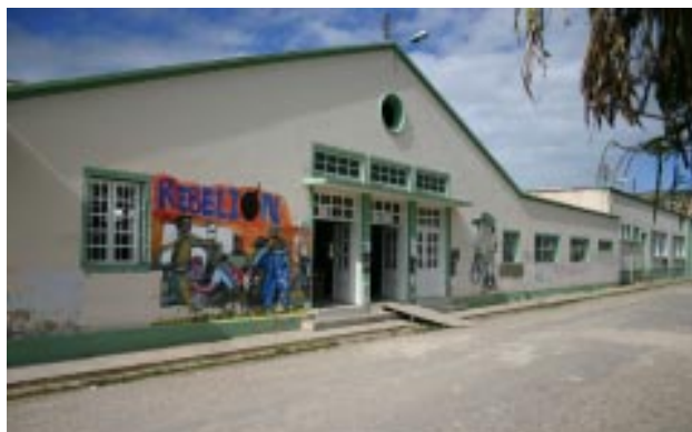
Restaurante Estudiantil Universidad Pedagógica y Tecnológica de Colombia

En el Cuadro No. 2 . De las cuentas en pesos constantes y reales se puede deducir brevemente, 17 a partir de la estructura porcentual y los índices de crecimiento del gasto por dependencias y por destino de la Universidad, como los objetivos propuestos en su creación era la preparación de profesores idóneos para servir eficazmente la enseñanza en las distintas ramas y especialidades de la educación pública y su vinculación al creciente desarrollo industrial y agrícola del país. Era una Institución Pedagógica para el magisterio colombiano y su misión era de alcance Nacional . Si revisamos el cumplimiento de estas metas, encontramos que uno fue el espíritu del Decreto-Ley 2655 del 10 de octubre de 1953, e interpretación de la historia de la entidad, y otra fue la realidad de estos primeros años de funcionamiento.