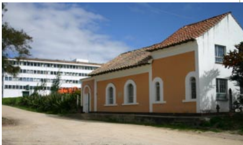
Sede Postgrado en Archivística Universidad Pedagógica y Tecnológica de Colombia

pasaban a aumentar el del año siguiente. Dada la autonomía de la institución no devolvió fondos al Tesoro Nacional. 25 La explicación que sea el concepto: Saldo de las Apropiaaciones o Saldo Aprovechable para la Vigencia siguiente, y no el superávit entre rentas y gastos se debe tal vez, el considerar que lo Apropiado y no Gastado, quedó como recursos que debían ser Recaudados más tarde y por lo tanto gastados.