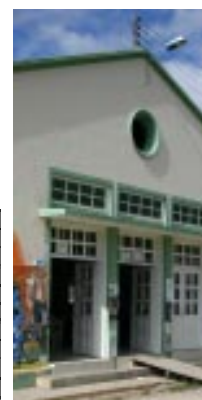
Detalle Restaurante Estudiantil Universidad Pedagógica y Tecnológica de Colombia

(1) Los gastos se comparan en pesos reales deflactando los corrientes para el Índice Nacional de Precios al por Mayor (INPM), Índice suministrado por Boletín Mensual de Estadística Nos. 527 - 528, p. 174