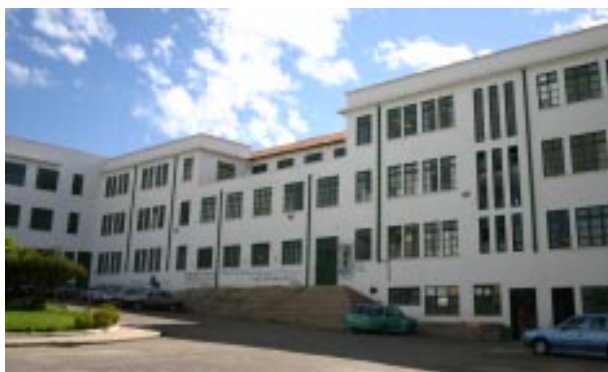
Detalle Cara Occidental. Detalle Edificio Central Universidad Pedagógica y Tecnológica de Colombia.

A manera de conclusión, se determina el costo real promedio por estudiante para cada año en la Sección Universitaria. En los años de 1955 y 1957, se comparan las dependencias, la proporción de estudiantes, el presupuesto ejecutado, el costo por alumno, el número de docentes y empleados, y los correspondientes índices de crecimiento. De esta manera, se