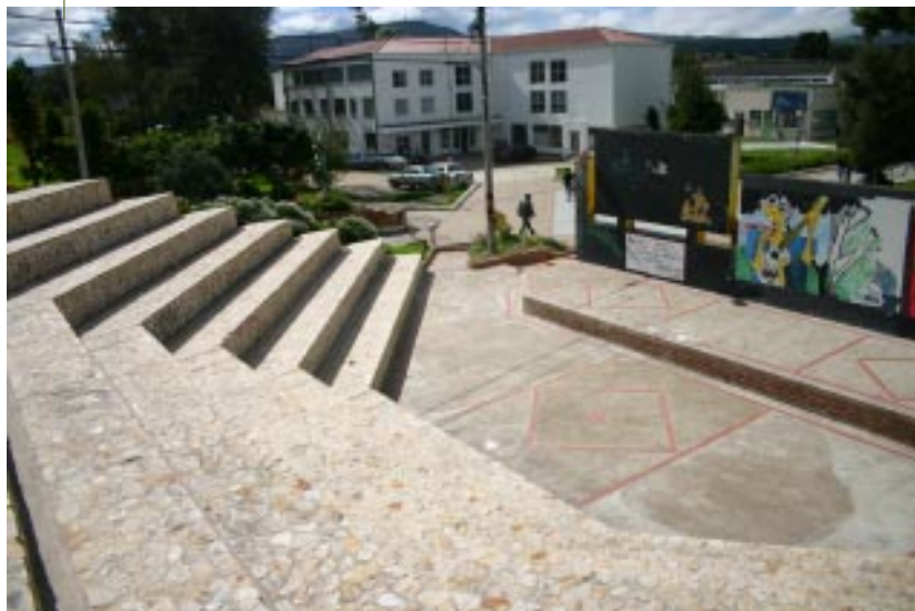
Plazoleta Universitaria Universidad Pedagógica y Tecnológica de Colombia