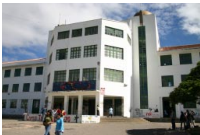
Detalle Edificio Central Universidad Pedagógica y Tecnológica de Colombia

En este contexto, la investigación en las áreas de la educación y la economía están relacionados y se presentan de acuerdo con la contribución que la economía pudo prestar a la investigación en el ámbito de la educación, sobre todo en el análisis del funcionamiento y resultado de los sistemas educativos. Campo de investigación más conocido como: La economía en la educación , la cual tuvo en cuenta por una parte, como los sistemas educativos poseen, o le son asignados, recursos limitados para el cumplimiento de sus objetivos. Estos pueden ser humanos, materiales o financieros, generalmente escasos, que eran asignados para alcanzar las metas del sistema de la mejor forma posible 1 .