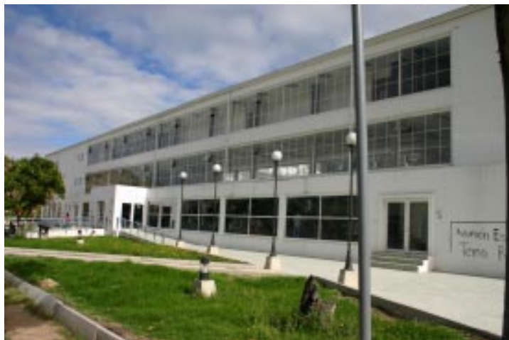
Detalle Edificio de Admisiones Universidad Pedagógica y Tecnológica de Colombia

La metodología en este estudio, fue la misma de la Historia de la Educación, la cual se relacionó con la Historia Económica; donde los cambios institucionales se dieron paralelamente a los cambios económicos. Los conceptos y métodos de la historia económica, resultaron imprescindibles para investigar aspectos internos de un centro educativo como la Universidad Pedagógica de