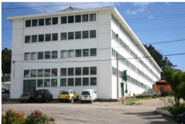
Detalle Edificio de Laboratorios Universidad Pedagógica y Tecnológica de Colombia

Desde el punto de vista de los índices de crecimiento de los gastos, por dependencias y según destino, se confirma la tesis anterior, mientras los egresos de la Universidad se incrementaron en un promedio anual del 67.6% en los años de 1953 a 1956, por el contrario los recursos de las entidades pedagógicas como la Sección Universitaria decrecieron en estos años en un promedio anual del 29% y de la Escuela Normal Superior, sólo se incrementaron en un 11.5% por año. Esta situación contrasta con dependencias como la Dirección General donde los recursos se incrementaron anualmente en un 20%, el Instituto Pedagógico Agrícola de Paipa con un 564% anual, la Escuela Normal Rural del Valle de Tenza, la cual debía ser anexada al Instituto, cuyos gastos se incrementaron en un 73.5% por año. La obligatoriedad, emanada por el Decreto –Ley de crear un Instituto Industrial, trajo consigo la eliminación de la Escuela de Artes y Oficios de Tunja, y el de Duitama, decreció sus gastos en un 21.4% en los dos últimos años observados en la investigación. El Centro Indígena de “El Sol” en Sogamoso, sus recursos desde el primer año decreció, igual