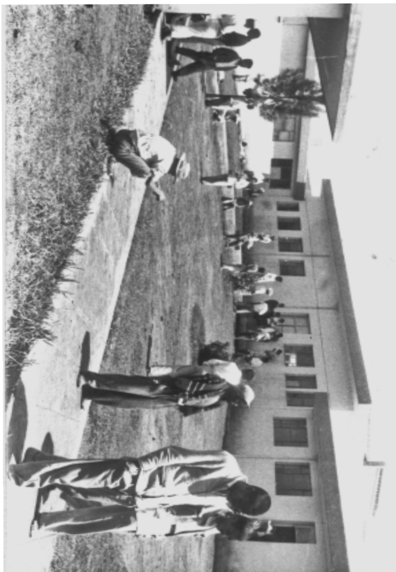
El Hospital en sus primeros años