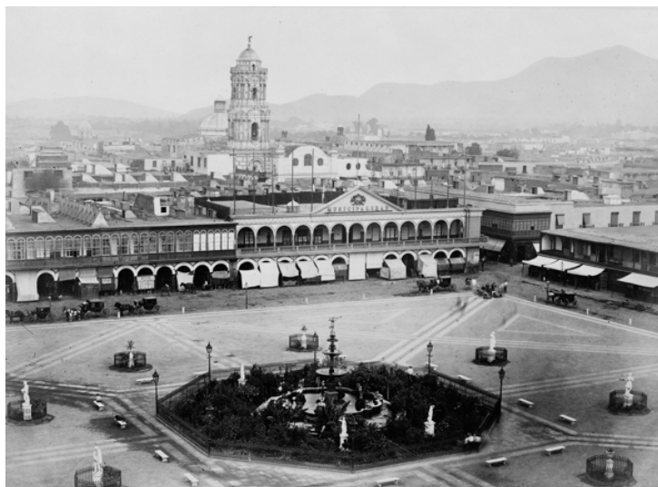
Figura 4. El centro de la ciudad de Lima, 1868. Sin Autor. 1868. Lima. The public square, Municipality, and tower of St. Domingo. Lima, [Photograph]