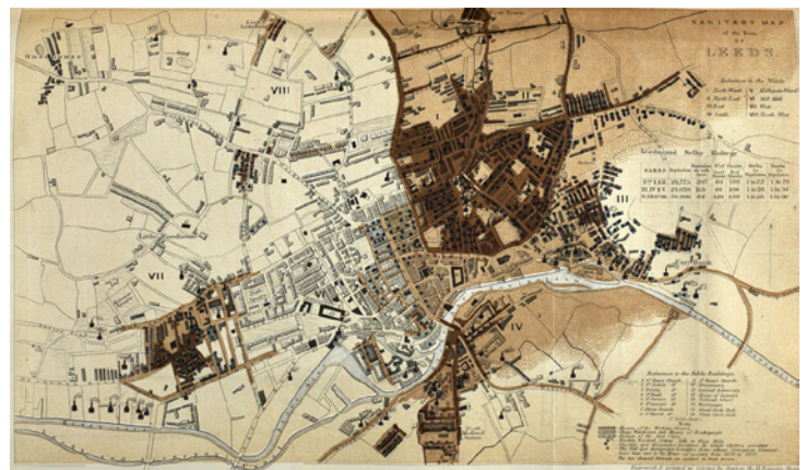
Figura 1. Mapa Sanitario de la ciudad de Leeds, 1842. Baker, Robert. 1842. Sanitary Map of the Town of Leeds. Cornell University Library. Disponible en https://digital.library.cornell.edu/catalog/ss:19343540 .