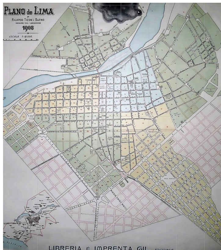
Figura 5. Idea de expansión del ingeniero Tizón i Bueno para Lima, 1908. Librería e Imprenta Gil, 1908.

[43] Franch, JF. La ciudad de Lima en el contexto de la evolución urbanística latinoamericana en el siglo XIX. Revista Storicamente. [Internet] 2006 [Consultado: 25, agosto, 2019]; (2): S/P. Disponible en: https://storicamente.org/02franch .