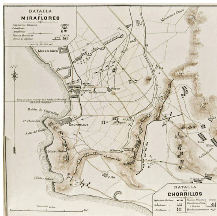
Figura 2. Batallas de Miraflores y de Chorrillos, entre Perú y Chile en 1881. Prieto, Carlos M. 1881. Batalla de Chorrillos. Biblioteca Digital Hispánica. Disponible en http://bdh.bne.es/bnsearch/Search.do?

[23] Orvañanos D. Noticia sobre la geografía médica del Valle de México. Memorias del 2º. Congreso Pan-Americano. México: Hoeck y Hamilton Impresores y Editores; 1898. p. 710-713.