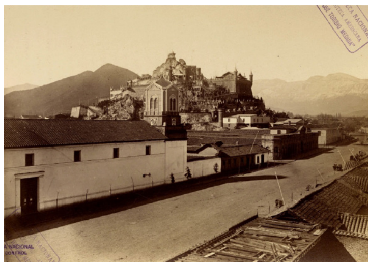
Figura 6. Mejora del Cerro Santa Lucía y sus alrededores, 1874. Vicuña, Mackenna, Benjamín. 1874. El Santa Lucía. Santiago: Imprenta de la Librería del Mercurio.