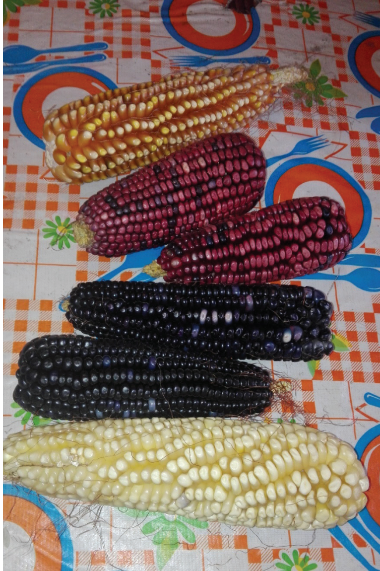
Figura 4. Mazorcas para intercambiar semillas