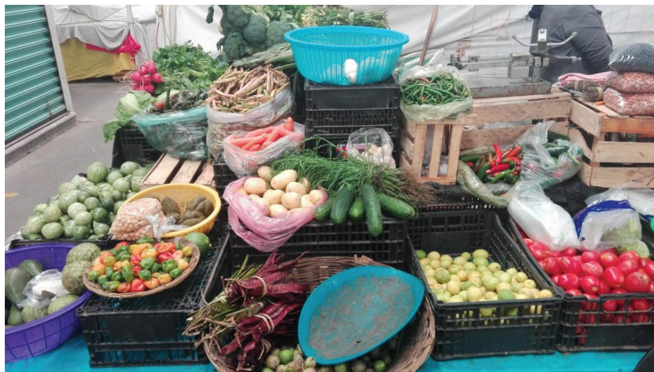
Figura 1. Venta de hortalizas frutas y semillas

Fotografía: Mayra Karina Solís López, 2019.