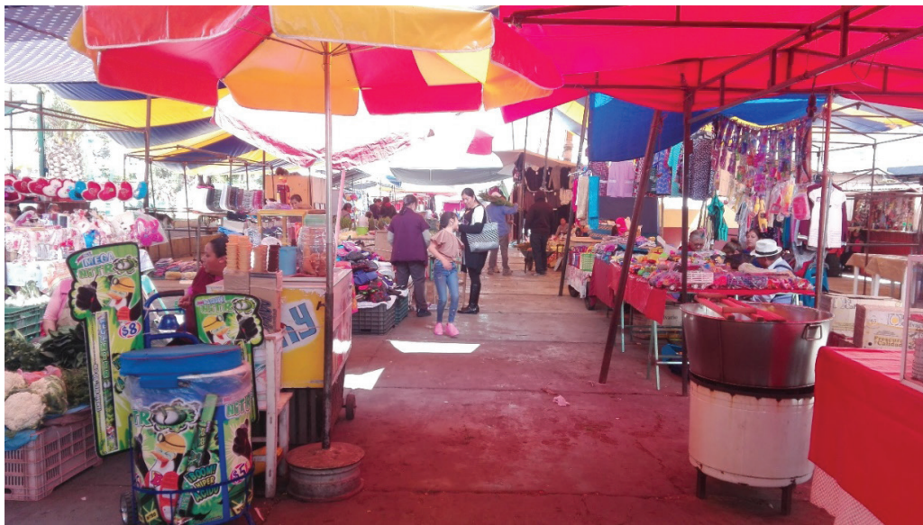
Figura 3. Tianguis semanal en San Nicolás de los Ranchos

Fotografía: Mayra Karina Solís López, 2020.