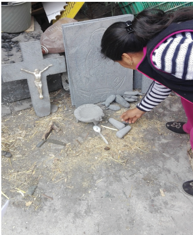
Fotografía: Mayra Karina Solís López, 2020.