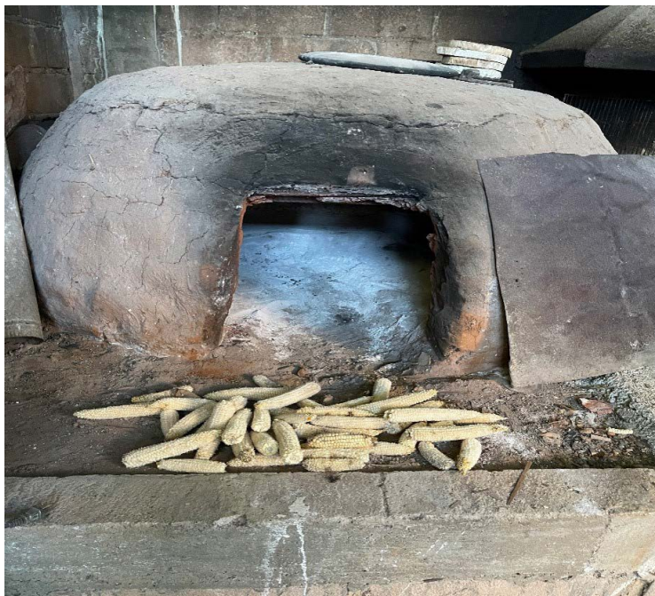
Figura 2. Horno de barro de las panaderas artesanales