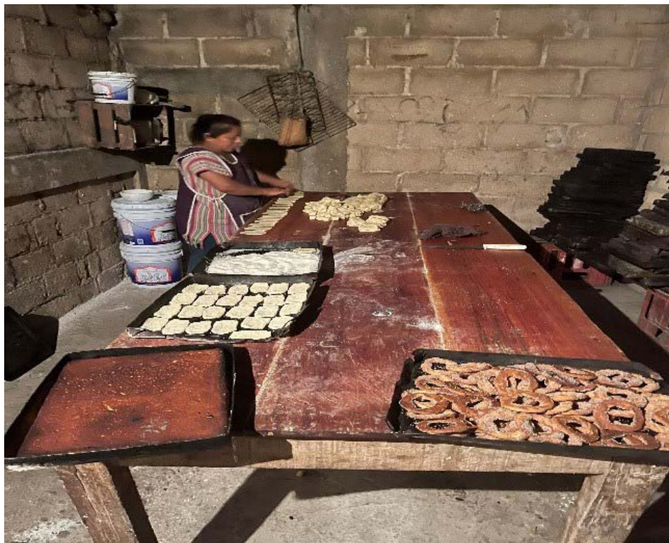
Figura 3. La pequeña fábrica de pan