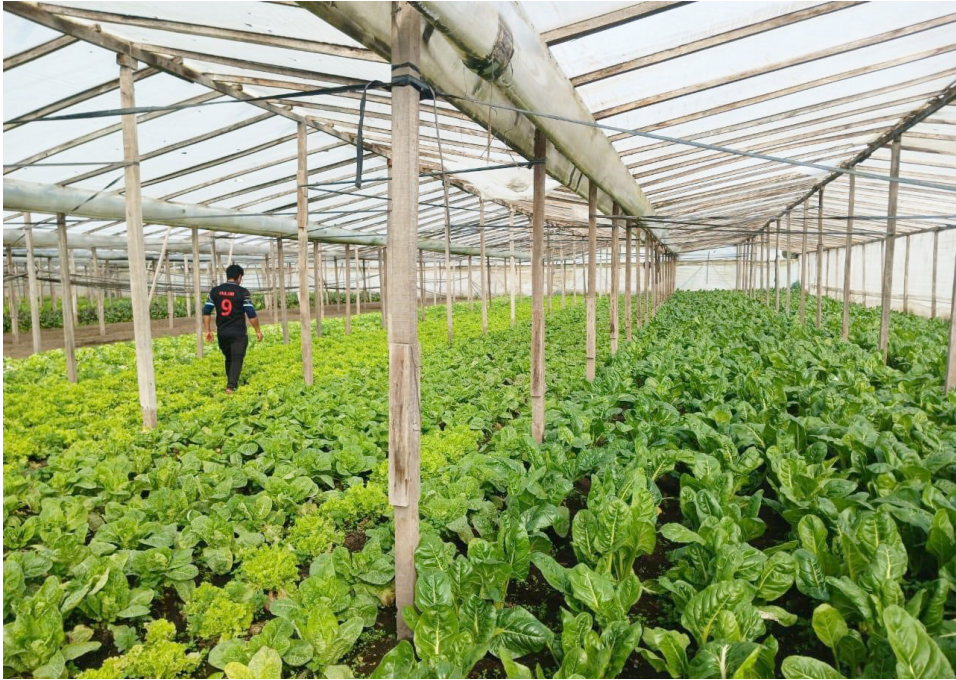
Figura 2. Espacio bajo cubierta (invernadero) de una quinta del cordón productivo platense

grado de exclusión y pobreza; las condiciones son severas, los servicios, escasos, y no hay agua potable (Fernández 2018; Lemmi et al. 2020).