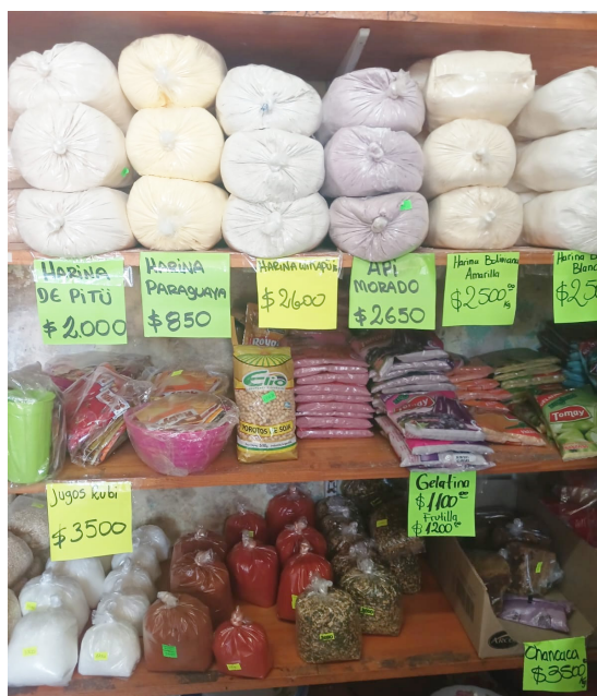
Figura 4. Legumbrería en Lisandro Olmos, La Plata