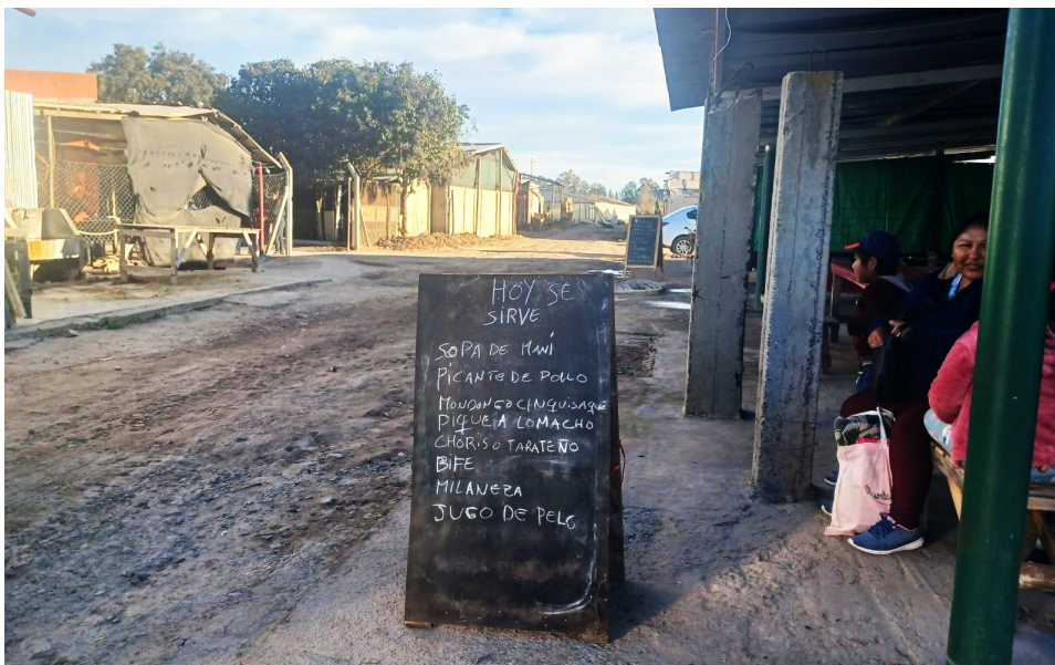
Figura 3. Cartel de comedor en Arturo Seguí