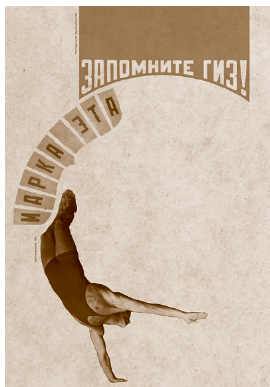
■ Sin título, 1923 | Alexander Rodchenko