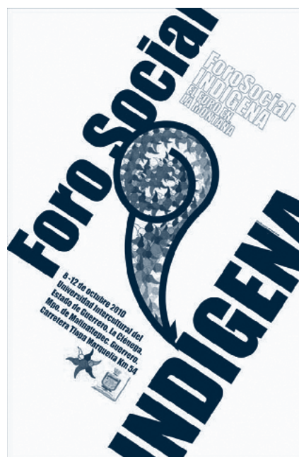
■ Foro Social Indígena, el foro en la montaña, 2010 Universidad Intercultural del Estado de Guerrero

De acuerdo con las prácticas y las trayectorias de los agentes sociales que participaron en la investigación, se observa que los procesos organizativos en función de la defensa de la vida, hacen que las formas de subjetivación transiten del gobierno de sí mismo (concepto que para Foucault implica hacerse cargo de uno mismo) a la emergencia de una alteridad radical, la cual exige la demanda ética por el otro (Lévinas, 2015). En consecuencia, desde una mirada trans-ontológica (Maldonado-Torres, 2007), la subjetividad y la alteridad se ubican de manera horizontal, alrededor de una responsabilidad legítima (no instrumental) entre el yo y los otros. Lo ratifica un joven líder de Asojorío: “Aunque estudio licenciatura en artes en Florencia, quiero regresar a mi comunidad. Tengo una responsabilidad enorme con mi comunidad. Si sigo imaginando y haciendo cosas, puedo hacer soñar a una comunidad entera. Ahí está la posibilidad de los cambios”.