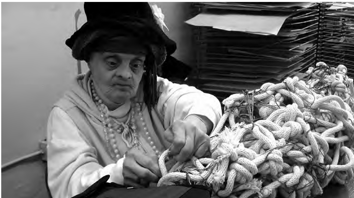
■ Judith Scott, artista estadounidense con Síndrome de Down en su taller

e incapacitadas para ejercer prácticas sexuales y reproductivas. Su sexualidad y cuerpo son fuente de patologización, opresión y materia prima de discursos promovidos por el Estado, los medios de comunicación masivos, la religión y el modelo biomédico, donde se las expropia del derecho a decidir sobre su corporalidad y su reproducción.