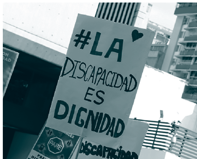
■ Cartel 'La discapacidad es dignidad' exhibido en manifestación, San Jose (Costa Rica), 2017

En el marco de la desexualización y feminización del cuerpo dis/capacitado, la lucha estratégica en favor de su feminidad y maternidad entra en tensión con la pelea contra la maternidad obligatoria y el aborto de los movimientos feministas, para los cuales este último fue uno de los medios históricos de adquisición de control sobre el cuerpo y la reproducción. Tanto el movimiento feminista como el de discapacidad coinciden en la reivindicación de derechos individuales sobre el cuerpo. Sin embargo, el aborto retrotrae la complicidad del movimiento feminista blanco, de clase media y sin discapacidad, con estrategias eugenésicas de control de la población, en el marco de la lucha de principios del siglo XX por la libre reproducción, materializada en medidas de esterilización forzosa y compulsiva contra mujeres menos privilegiadas, que continúan hasta hoy.