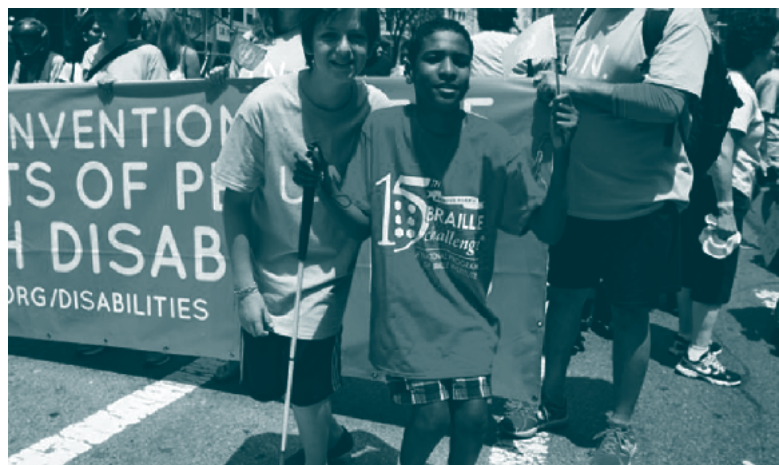
■ Desfile del Orgullo de la Discapacidad, Nueva York (Estados Unidos), 2015

Investigaciones iberoamericanas centradas en experiencias encarnadas relevan las prácticas de biopoder y de eugenesia, así como también las resistencias