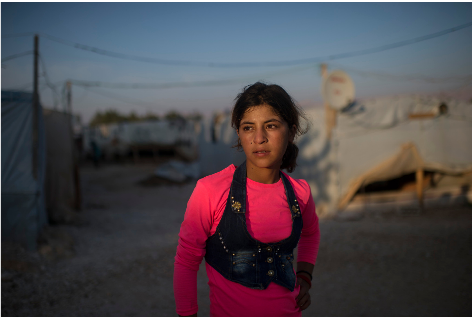
▪ Niña en un asentamiento informal de refugiados sirios. Valle de Bekaa (Líbano), 2005