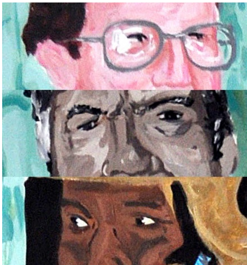
▪ Banda de peruanos (fragmento), pintura, acrílico sobre lienzo (196 x 143 cm) | SERIE RECORTES DE PRENSA. Andrés Orjuela, 2016

En varias ocasiones, incluso en el pequeño ensayo L’imagination et l’imaginaire , citado anteriormente,