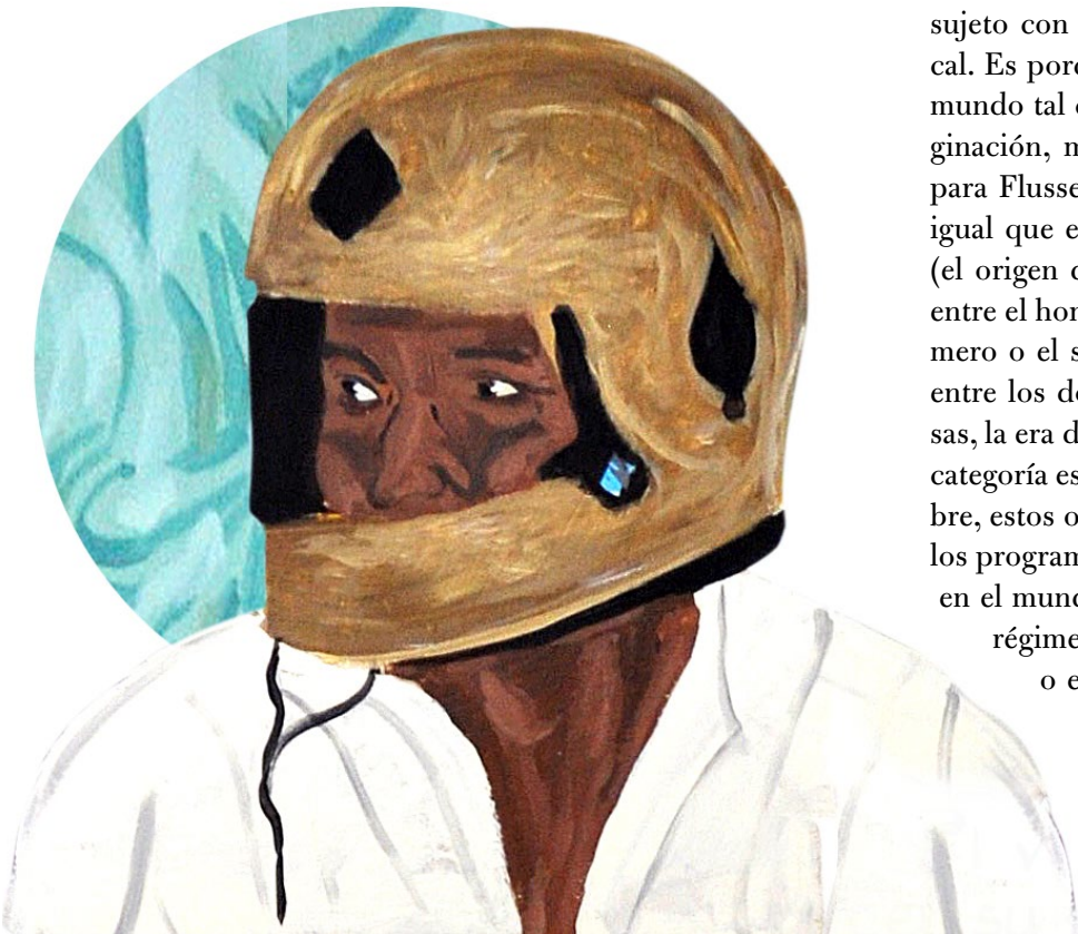
▪ Banda de peruanos (fragmento), pintura, acrílico sobre lienzo (196 x 143 cm) | SERIE RECORTES DE PRENSA. Andrés Orjuela, 2016