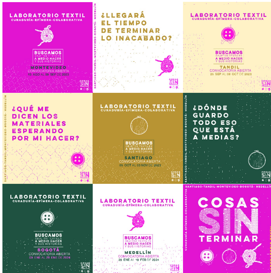
Imagen 1. Piezas de divulgación de la convocatoria.

Estas convocatorias buscaron piezas textiles sin terminar que estuvieran atesorados a escala doméstica, para indagar en su compañía y en la de sus guardianas y guardianes por lo que tenían para decirnos sobre la historia personal de cada postulante (imagen 1). En cada ciudad se postularon entre veinte y cincuenta objetos textiles, de los cuales seleccionamos, en cada caso, entre ocho y diez 6 .