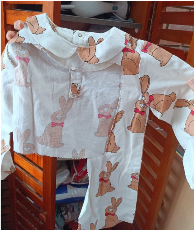
Imagen 4. Prenda destruida para sacar de ella un retazo ortogonal.