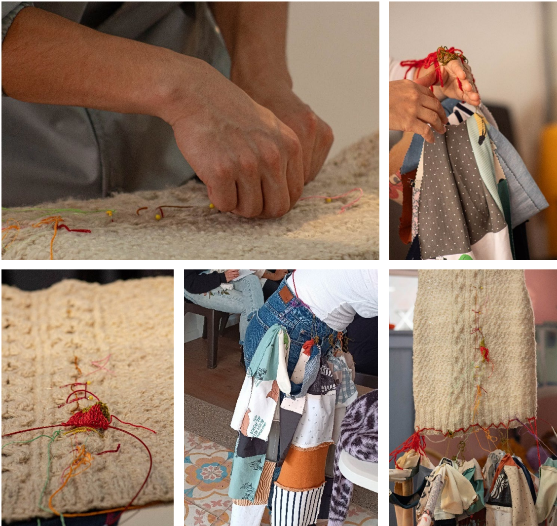
Imagen 5. Instalaciones efímeras de Pa y Jo.