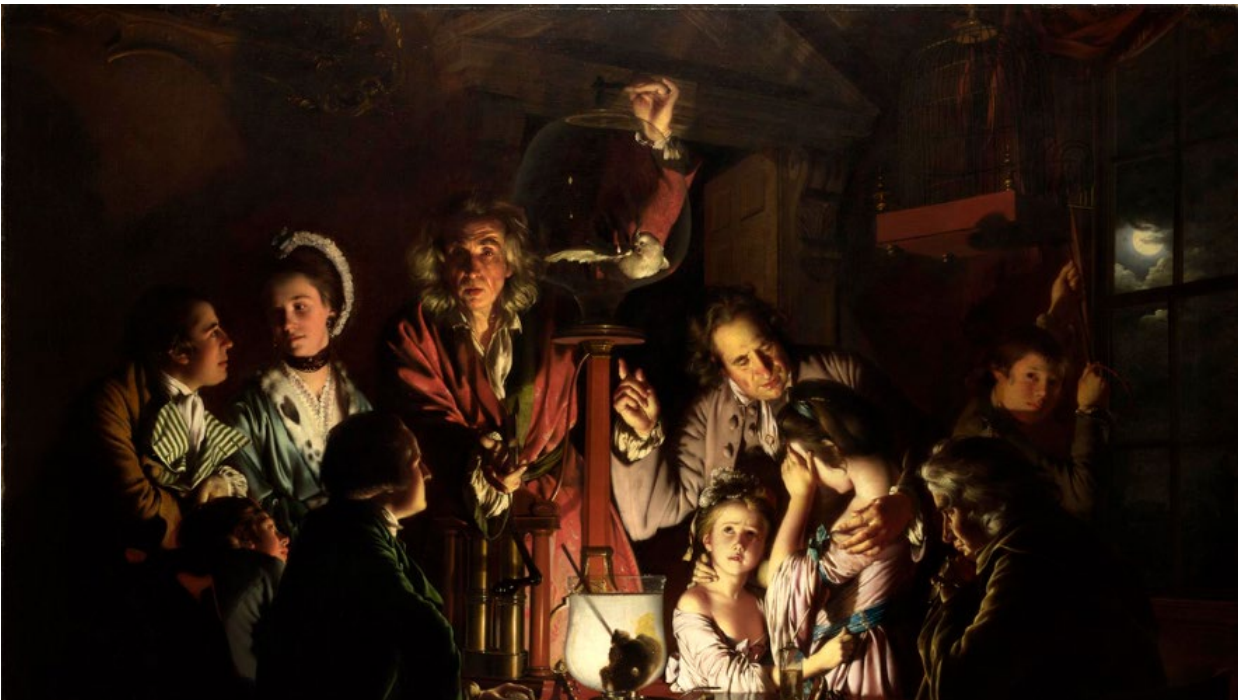
Imagen 3 An Experiment on a Bird in the Air Pump (1768). Pintura de Joseph Wright of Derby