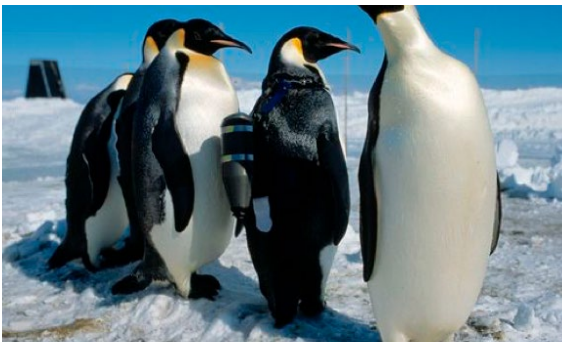
Imagen 1. Pingüinos emperador con crittercams a sus espaldas

En la Antártida, cada mes de marzo desde el principio de los tiempos, el reto para encontrar la pareja perfecta e iniciar una familia, comienza. Este cortejo se inicia con un largo viaje, que los llevará cientos de millas a través del continente a pie, bajo temperaturas heladas, con vientos quebradizos y a través de aguas profundas y traicioneras. Ellos se arriesgarán al hambre y ataque de depredadores peligrosos, bajo las más duras condiciones en la tierra, todo para encontrar el amor verdadero. (Warner Bros, 2017)