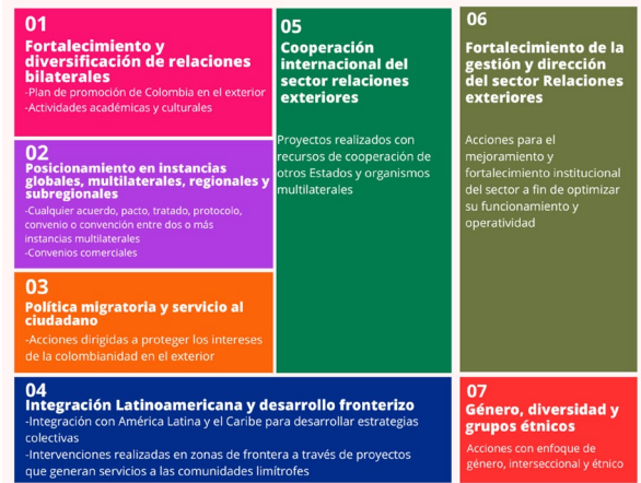
Gráfica 3. Ejes de transformación hacia el exterior: una mirada del exterior hacia el exterior