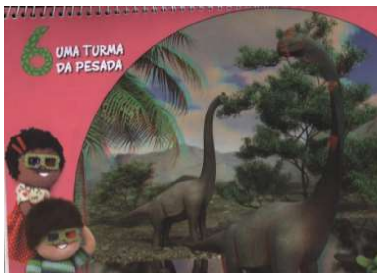
Figura 1 – Ilustração introdutória da unidade didática 6

Após o exposto, iniciamos nossa análise, enumerando impressões semióticas da ilustração que introduz a unidade 6, conforme a teoria sýgnica de Peirce (2005), apresentada neste trabalho.