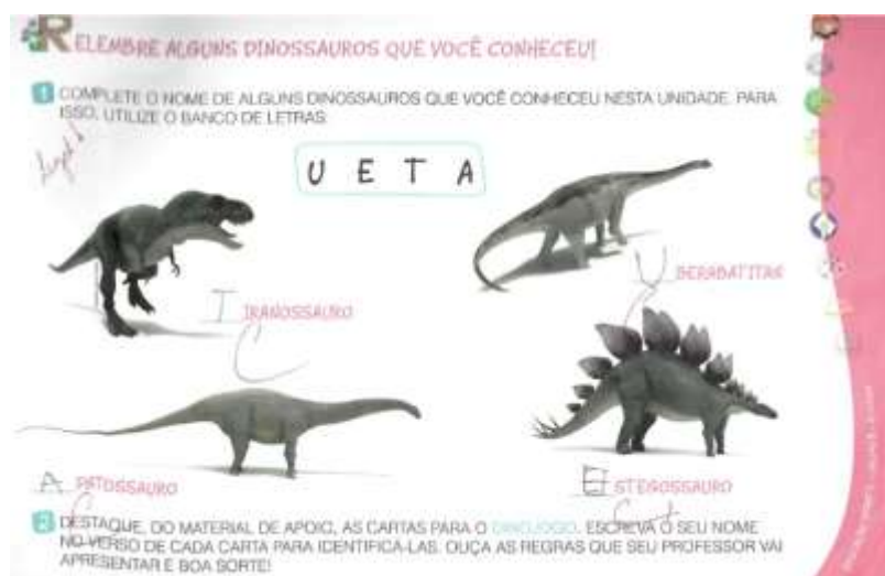
Figura 3 – Atividade de escrita: retomando nomes de dinossauros