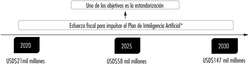
Tabla 3. Estado de la estandarización en la industria de IA a 2018 (continuación)

Fuente: elaboración propia con base en China Electronics Standardization Institute (2018, sec. Apéndice 1). Los datos de proyecciones presupuestales fueron tomados de Roberts et al. (2021).